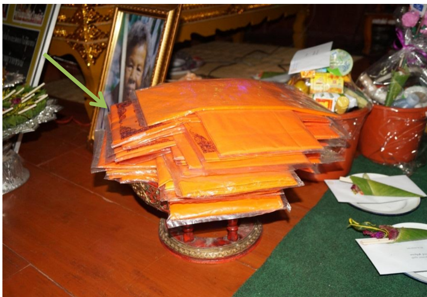
ภาพ 6 ผ้าบังสุกุลในพิธีสวดพระอภิธรรมศพ

จากการสัมภาษณ์ พระอธิการสนิท สุชาโต กล่าวว่า ในการสวดพระอภิธรรมของ หมู่บ้านดงอินตาประมาณ 20 ปีที่ผ่านมา จะใช้ผ้าบังสุกุลจำนวน 4 ผืน สำหรับให้บรรดาลูก ๆ ญาติ ๆ วางพร้อมกันต่อหน้าพระสงฆ์เท่านั้น แต่ในปัจจุบันจะมีการเชิญแขกมามากมายในการ วางผ้าบังสุกุลอย่างน้อย 20 ผืน โดยเฉพาะคืนสุดท้ายบางงานจะวางเท่ากับอายุผู้ตายก็มี พระสงฆ์จะนั่งพิจารณาโดยใช้บทสวดว่า อะนิจจา ะตะ สะขารา... ฯลฯ 3 รอบ (พระอธิการสนิท สุชาโต, ผู้ให้สัมภาษณ์, 9 มกราคม 2559) ในขณะเดียวกัน พระครูสุทัศน์นพกิจ ยังได้ กล่าวว่า ปัจจุบันยังมีการพัฒนาการวางผ้าบังสุกุลจะเป็นจิวรสำเร็จ และมีการทอดผ้าบังสุกุล ตั้งแต่พิธีสวดพระอภิธรรม และพอแห่ศพไปที่ป่าช้า จะมีการทอดผ้าบังสุกุลอีกครั้งหนึ่งตาม จำนวนผ้าที่มีในงานนั้นจนหมดจะวนก็รอบก็ตาม ผ้ามหาบังสุกุลคือผ้าไตรจิวรครบชุด ผ้าบังสุกุล คือผ้าสบง