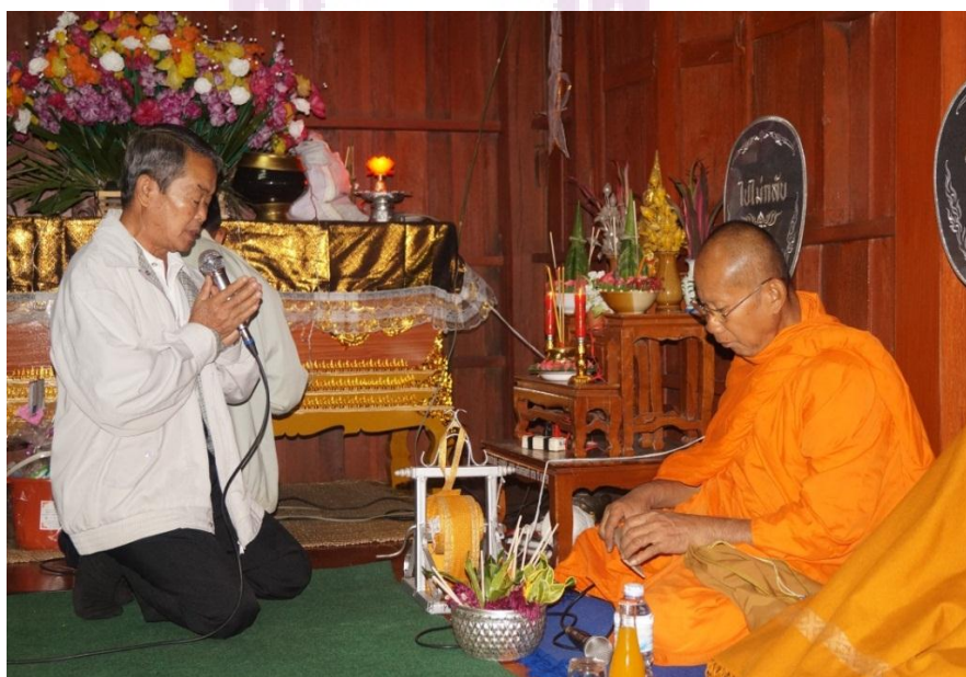
ภาพ 13 มัคทายกหรือปู่อาจารย์นำแขกประกอบพิธี

จากการศึกษา พบว่า มัคทายกที่เป็นผู้ประกอบพิธีสวดพระอภิธรรมของหมู่บ้านดงอินตามีเพียง 1 คน ดังภาพ 13