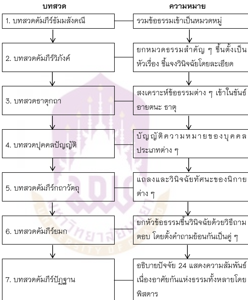
ตาราง 2 แสดงแผนภูมิ บทสวดพระอภิธรรมเจ็ดคัมภีร์และความหมาย

จากที่กล่าวมาทั้งหมดนี้บทสวดพระอภิธรรมเจ็ดคัมภีร์และความหมาย สามารถสรุปได้ ตามตารางแสดงแผนภูมิต่อไปนี้