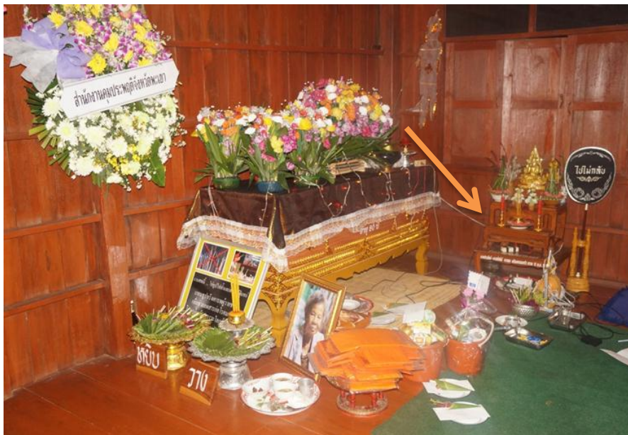
ภาพ 1 โต๊ะหมู่บูชาในพิธีสวดพระอภิธรรมศพ

จากการสัมภาษณ์ พระครูสุทัศนูปกิจ ท่านยังได้กล่าวต่ออีกว่า ประมาณ 10 ปีที่ผ่านมาการบูชาพระรัตนตรัยจะใช้รูปเทียนจริงในการบูชาแต่ในปัจจุบันนิยมใช้รูปเทียนไฟฟ้า เพราะทางหน่วยงานด้านสาธารณสุขได้ประกาศเตือนให้ชาวบ้านว่าการใช้รูปเทียนจะทำให้เกิดอันตรายจากควันธูป เช่น โรคทางเดินหายใจ โรคมะเร็ง เป็นต้น ทำให้ชาวบ้านและหน่วยงานท้องถิ่นรณรงค์ใช้เป็นแบบรูปเทียนไฟฟ้าเพื่อบูชาพระรัตนตรัยแทน เพื่อความปลอดภัยด้านสุขภาพ (พระครูสุทัศนูปกิจ, ผู้ให้สัมภาษณ์, 9 มกราคม 2559)