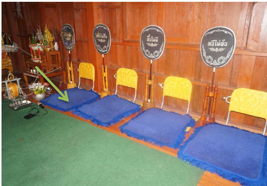
ภาพ 3 อาสนะสงฆ์ในพิธีสวดพระอภิธรรมศพ

ส่วนพระสงฆ์ที่จะนั่งสวดพระอภิธรรม รวมถึงพระสงฆ์ที่จะเป็นองค์เทศนาธรรมจะนั่งอยู่กับอาสนะลำดับที่ 1 ถึง 4 ตามลำดับพรรษาของพระสงฆ์ เว้นแต่ว่าคืนไหนเจ้าภาพจะนิมนต์พระนักเทศน์ต่างอำเภอ ต่างจังหวัดอื่นมาเทศนาธรรมจะต้องมีการจัดอาสนะสงฆ์ไว้อีกหนึ่งซึ่งจำเป็นต้องใช้ธรรมาสน์ด้วย สามารถสังเกตได้ว่าพระสงฆ์ที่เป็นองค์เทศน์ แม้จะมีอายุพรรษาน้อยก็ตามจะได้รับเกียรติให้นั่งบนอาสนะในธรรมาสน์เสมอ และผู้ร่วมพิธี แม้กระทั่งพระสงฆ์ที่สวดพระอภิธรรมต้องพนมมือฟังเทศนาธรรมด้วยความเคารพเป็นการเพิ่มความศักดิ์สิทธิ์ให้กับพิธีกรรมมากยิ่งขึ้น