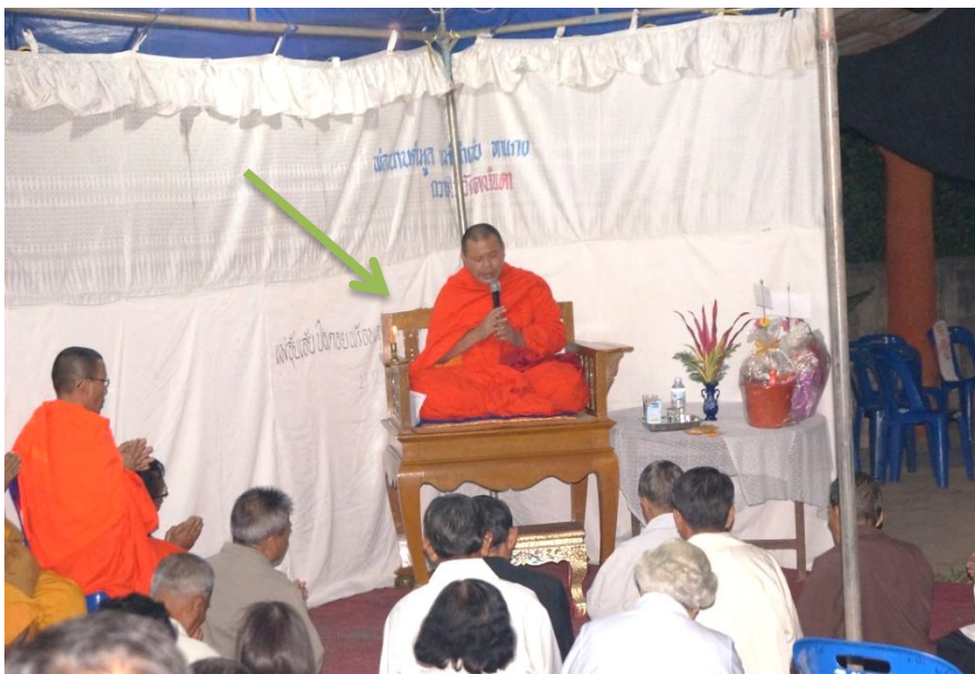
ภาพ 5 พระสงฆ์เทศนาธรรมแบบบรรยาย

จากการศึกษา พบว่า ธรรมเนียมสำหรับพระสงฆ์นั่งเทศน์นั้นจะนิยมจัดในคืนสุดท้ายของการสวดพระอภิธรรมจะจัดเฉพาะงานที่เจ้าภาพนิมนต์พระนักเทศน์นอกเขตหมู่บ้านมาเทศนาธรรมเท่านั้นจะตั้งด้านล่างของบ้านสถานที่กว้างขวางหันหน้าไปด้านแขกที่มาร่วมพิธี เพื่อให้ผู้เทศนาธรรมและแขกได้เห็นหน้ากันชัดเจน บริเวณธรรมาสน์จะประกอบด้วย เทียนสองธรรมอยู่ด้านขวามือของพระเทศน์ ด้านซ้ายมือของพระเทศน์เป็นเครื่องไทย ดังภาพ 5 แต่ถ้าเป็นพระสงฆ์ที่เทศนาธรรมจำพรรษาอยู่ในเขตหมู่บ้านดวงอินตาจะไม่นิยมจัดธรรมาสน์เพราะเห็นว่าเป็นเรื่องยุ่งยากสำหรับเจ้าภาพในการขนย้ายจากที่วัดไปบ้านจะใช้กรณีพิเศษที่กล่าวมาข้างต้นเท่านั้น