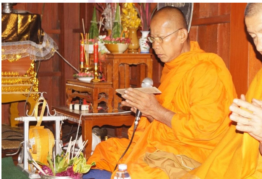
ภาพที่ 12 พระสงฆ์เทศนาธรรม

จากการศึกษา พบว่า พระสงฆ์ผู้เทศนาธรรมมีจำนวน 1 รูป มีการเทศนาธรรมจำนวน 1 ถิ่นต์ของแต่ละคืนในพิธีสวดพระอภิธรรม โดยจะเทศนาหลังจากที่มีการสวดพระอภิธรรมเสร็จ พระสงฆ์ที่เทศนาธรรมส่วนใหญ่จะจำพรรษาอยู่ในวัดของหมู่บ้านดงอินตาดังภาพ 12