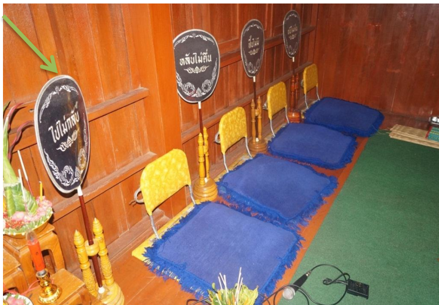
ภาพ 4 ตาลปัตรในพิธีสวดพระอภิธรรมศพ