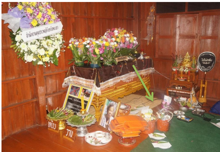
ภาพ 7 เครื่องไทยธรรมในพิธีสวดพระอภิธรรมศพ

7. เครื่องไทยธรรม จากการศึกษา พบว่า นอกจากจะเตรียมเครื่องไทยธรรม เพื่อถวายพระสงฆ์ผู้สวดพระอภิธรรมและพระสงฆ์ผู้เทศนาธรรมแล้วนั้น ยังมีเครื่องไทยธรรมสำหรับถวายพระพุทธรูปที่โต๊ะหมู่บูชา และสำหรับมอบให้แก่หมคนายกหรือปุ้ออาจารย์อีก 1 ชุด ดังภาพ 7