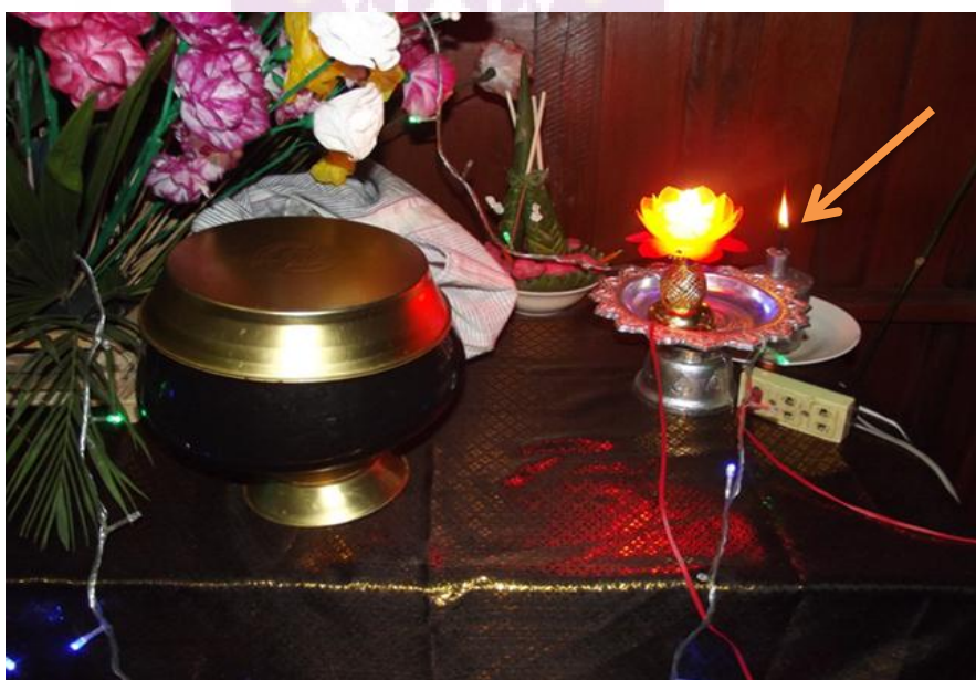
ภาพ 2 ตะเกียงจุดไฟหน้าศพในพิธีสวดพระอภิธรรมศพ