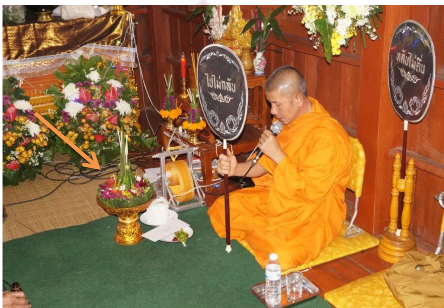
ภาพ 9 ชั้นศีลในพิธีสวดพระอภิธรรมศพ

9. ชั้นศีล คำว่าชั้นศีล มีนักวิชาการได้อธิบายความหมายไว้ว่า พานที่ใช้ประดับพระสงฆ์ก่อนอาราธนาศีล ซึ่งมักจะนำดอกไม้ ฐูปเทียน ใส่ลงในชั้นหรือพานเป็น 2 ส่วน คือส่วนที่หนึ่งใช้บูชาไตรสรณคมน์คือพระพุทธ พระธรรม และพระสงฆ์ ส่วนที่สองใช้บูชาศีล ชั้นศีลนั้นมีขนาดกว้างสูงประมาณ 1 ศอกขนาดกว้าง 12-15 นิ้ว ใช้ใส่ดอกไม้ ฐูปเทียนอย่างละ 9 ดอก หมายถึงไตรสรณคมน์ บางแห่งใช้เพียงอย่างละ 3 ดอกหมายถึงพระรัตนตรัย หรืออย่างละ 5 ดอกก็มี ซึ่งอาจหมายถึง พระพุทธ พระธรรม พระสงฆ์ ปิตามารดา และครูอาจารย์ (มณีพยอมยงค์, 2549, หน้า 35) ดังภาพ 9