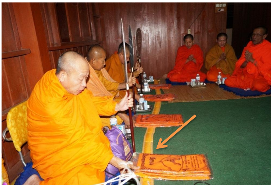
ภาพ 10 สายโยงที่ใช้ทอดผ้าบังสุกุล

10. สายโยง คือสายสิญจน์ที่โยงมาจากศพ จากการศึกษา พบว่า สายโยงจะเป็นแผ่นผ้าความกว้างประมาณ 2 นิ้ว เรียกอีกอย่างหนึ่งว่า ภูเขาโยง สายโยงหรือภูเขาโยงใช้เป็นที่ทอดวางผ้าบังสุกุลให้กับพระสงฆ์พิจารณาผ้าบังสุกุล ดังภาพ 10