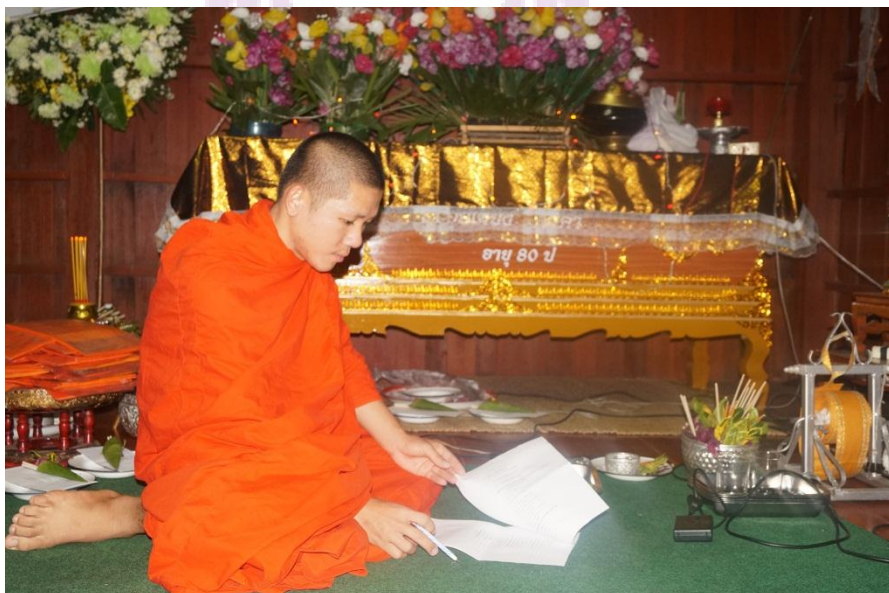
ภาพ 6 สังเกตสิ่งของต่าง ๆ ที่ใช้ในพิธีกรรมสวดพระอภิธรรมศพ