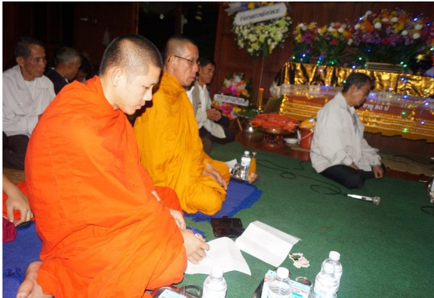
ภาพ 5 สังเกตและบันทึกเสียงสดในพิธีกรรมสวดพระอภิธรรมศพ