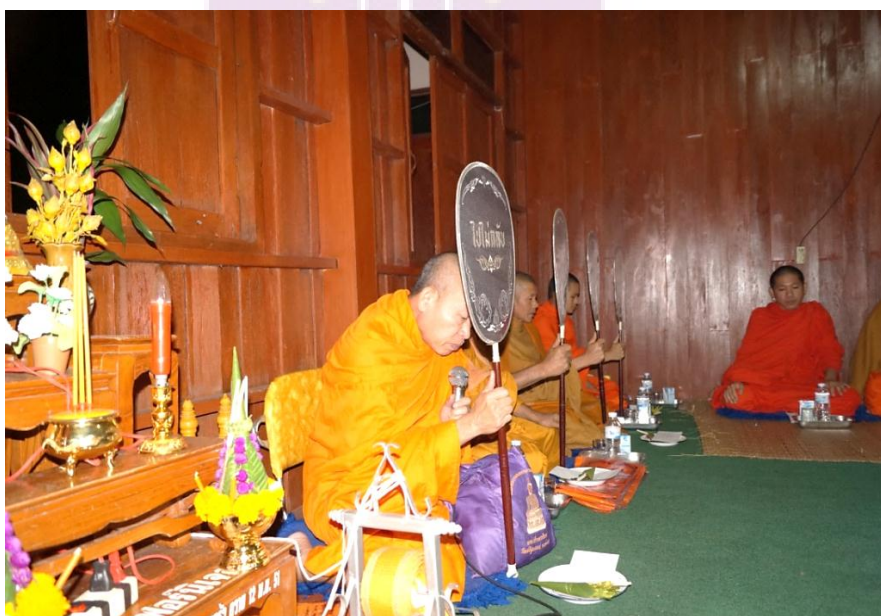
ภาพ 11 พระสงฆ์ผู้สวดพระอภิธรรม

จากการศึกษา พบว่า พระสงฆ์ผู้ประกอบพิธีสวดพระอภิธรรมจะนั่งเรียงตามลำดับอาวุโสหรือตามลำดับพรรษาถ้าพรรษามากกว่าก็จะได้รับเกียรติให้เป็นประธานผู้นำสวดพระอภิธรรมโดยจะถือไม้ค้ำหัวข้อบทสวดแต่ละบทจนครบเจ็ดคัมภีร์ ดังภาพ 11