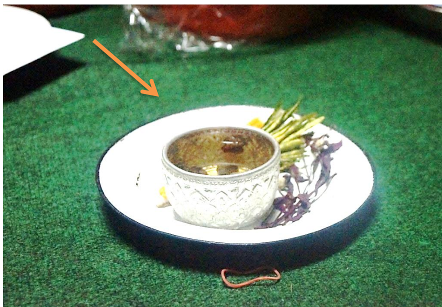
ภาพ 8 ชั้นสุมาคร้วทานในพิธีสวดพระอภิธรรมศพ

8. ชั้นสุมาคร้วทาน จาการการศึกษา ชั้นสุมาคร้วทานในพิธีสวดพระอภิธรรมศพ คือ พานหรือจานดอกไม้ ข้าวตอก และน้ำสั้มป่อย ที่จัดไว้เพื่อขอขมาโทษต่อวัสดุ ดังภาพ 8