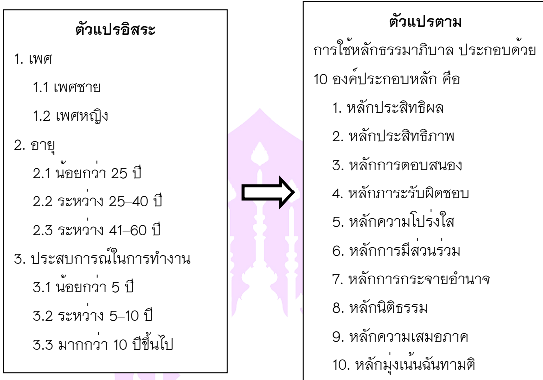
ภาพ 1 แสดงกรอบแนวคิดการวิจัย