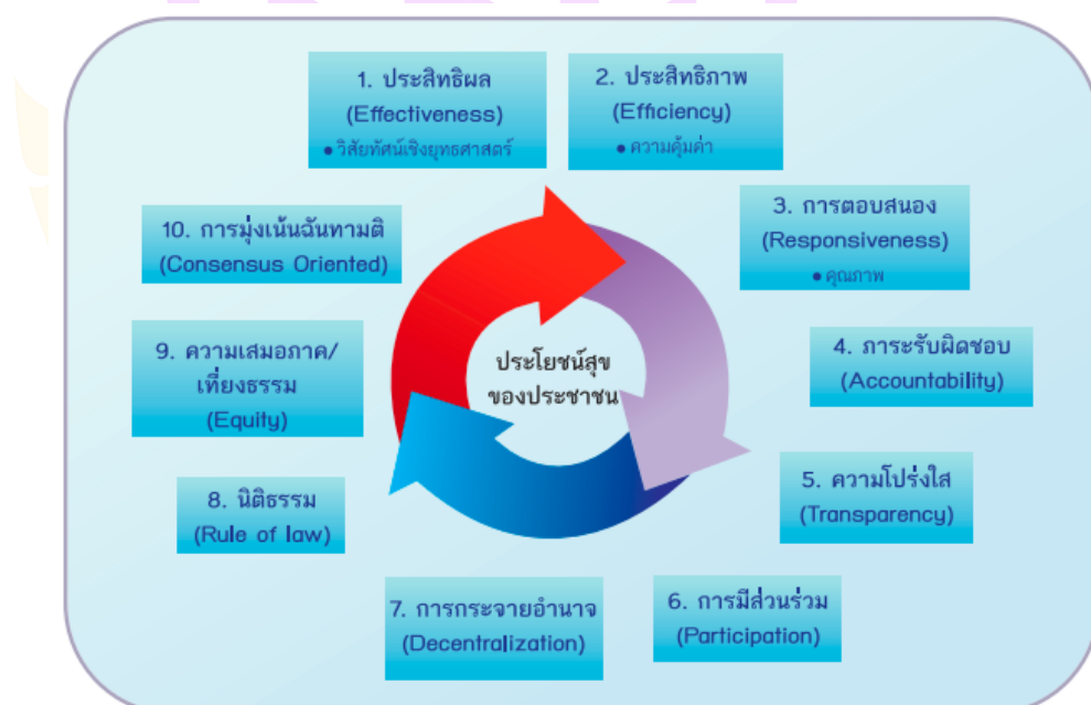
ภาพที่ 2 หลักธรรมาภิบาลของการบริหารกิจการบ้านเมืองที่ดี 10 องค์ประกอบ

10. หลักมุ่งเน้นฉันทามติ (Consensus Oriented): การหาข้อตกลงทั่วไปภายในกลุ่มผู้มีส่วนได้ส่วนเสียที่เกี่ยวข้อง ซึ่งเป็นข้อตกลงที่เกิดจากการใช้กระบวนการเพื่อหาข้อคิดเห็นจากกลุ่มบุคคลที่ได้รับประโยชน์และเสียประโยชน์ โดยเฉพาะกลุ่มที่ได้รับผลกระทบโดยตรงซึ่งต้องไม่มีข้อคัดค้านที่ยุติไม่ได้ในประเด็นที่สำคัญ โดยฉันทามติไม่จำเป็นต้องหมายความว่า เป็นความเห็นพ้องโดยเอกฉันท์