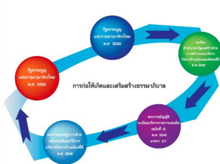
ภาพที่ 1 นโยบายที่ก่อให้เกิดการเสริมสร้างหลักธรรมาภิบาล