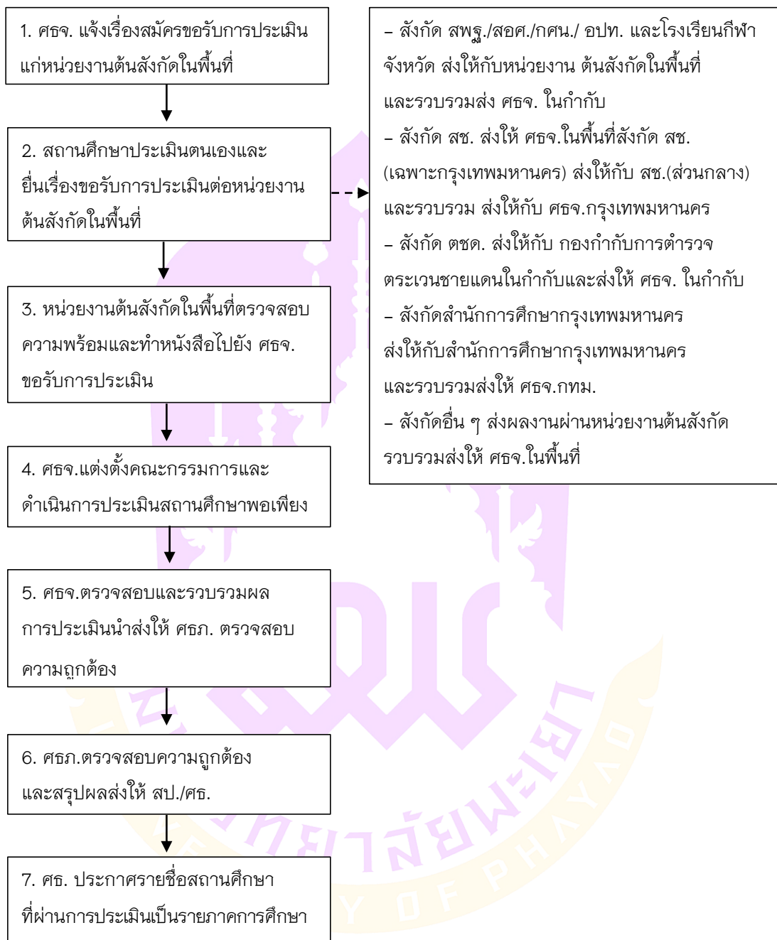
ภาพ 2 ขั้นตอนการขอรับการประเมิน และประกาศผลการประเมิน