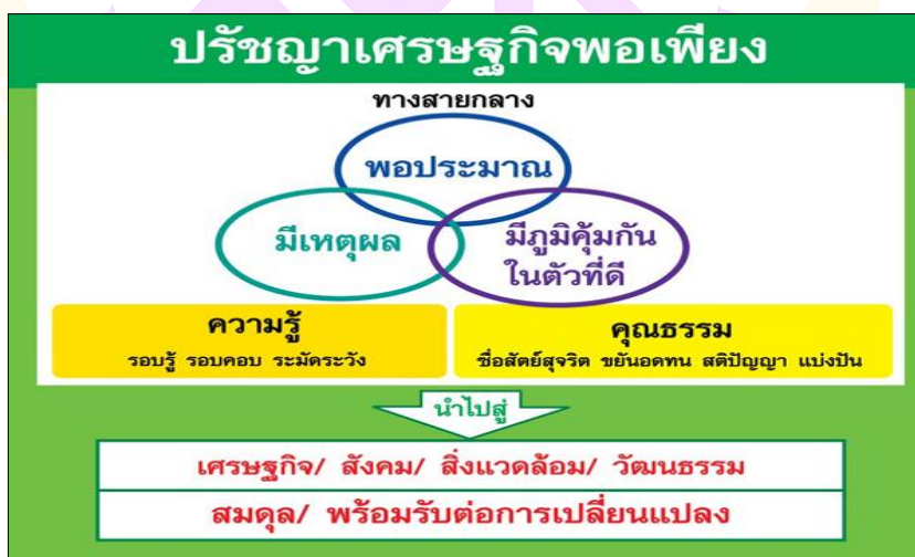
ภาพ 1 ปรัชญาของเศรษฐกิจพอเพียง

“เศรษฐกิจพอเพียง” เป็นปรัชญาที่ถึงแนวการดำรงอยู่และปฏิบัติตนของประชาชนในทุกระดับ ตั้งแต่ระดับครอบครัว ระดับชุมชน จนถึงระดับรัฐ ทั้งในการพัฒนาและบริหารประเทศให้ดำเนินไปในทางสายกลาง โดยเฉพาะการพัฒนาเศรษฐกิจเพื่อให้ก้าวทันต่อยุคโลกาภิวัตน์ ความพอเพียง หมายถึง ความพอประมาณ ความมีเหตุผล รวมถึงความจำเป็นที่จะต้อง มีระบบภูมิคุ้มกันในตัวที่ดี พอสมควร ต่อการมีผลกระทบใด ๆ อันเกิดจากการเปลี่ยนแปลง ทั้งภายนอกและภายใน ทั้งนี้จะต้องอาศัยความรอบรู้ ความรอบคอบ และความระมัดระวัง อย่างยิ่งในการนำวิชาการต่าง ๆ มาใช้ในการวางแผนและการดำเนินการทุกขั้นตอน และขณะเดียวกันจะต้องเสริมสร้างพื้นฐานจิตใจของคนในชาติ โดยเฉพาะเจ้าหน้าที่ของรัฐ นักทฤษฎีและนักธุรกิจในทุกระดับ ให้มีสำนึกในคุณธรรม ความซื่อสัตย์สุจริต และให้มีความรอบรู้ที่เหมาะสม ดำเนินชีวิตด้วยความอดทน ความเพียรมีสติ ปัญญา และความรอบคอบ เพื่อให้สมดุลและพร้อมต่อการรองรับการเปลี่ยนแปลงอย่างรวดเร็วและกว้างขวางทั้งด้าน วัตถุ สังคม สิ่งแวดล้อม และวัฒนธรรมจากโลกภายนอกได้เป็นอย่างดี (ประมวลและกลั่นกรองจากพระราชดำรัสของพระบาทสมเด็จพระเจ้าอยู่หัว เรื่องเศรษฐกิจพอเพียง ซึ่งพระราชทานในวโรกาสต่างๆ รวมทั้งพระราชดำรัสอื่นๆที่เกี่ยวข้อง โดยได้รับพระราชทานพระบรมราชานุญาตให้นำไปเผยแพร่ เมื่อวันที่ 29 พฤศจิกายน 2542 เพื่อเป็นแนวทางปฏิบัติของทุกฝ่ายและประชาชนโดยทั่วไป)