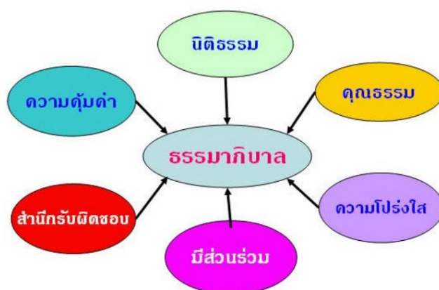
ภาพ 1 ดัชนีวัดธรรมาภิบาลบนพื้นฐานของหลักการทั้ง 6 หลักการ

ธรรมาภิบาล ประกอบไปด้วยหลักการสำคัญหลายประการ แล้วแต่วัตถุประสงค์ขององค์กรที่นำมาใช้หลักการที่มีผู้นำไปใช้เสมอคือ การมีส่วนร่วมของประชาชน การมุ่งฉันทามติ การมีสำนึกรับผิดชอบ ความโปร่งใส การตอบสนอง ประสิทธิภาพและประสิทธิภาพ ความเท่าเทียมกัน และการคำนึงถึงคนทุกกลุ่มหรือพหุภาคีและการปฏิบัติตามหลักนิติธรรม แต่ระเบียบสำนักนายกรัฐมนตรีว่าด้วยการบริหารกิจการบ้านเมืองและสังคมที่ดีนั้นได้ระบุไว้ 6 หลักการดังกล่าวมาแล้วและกลายเป็นหลักการสำคัญที่มีการนำมาใช้ในประเทศไทยอย่างกว้างขวางอยู่ในปัจจุบันนี้ แต่ก็มีคำถามว่าหลักการต่าง ๆ นี้หมายถึงอะไร แล้วจะทราบได้อย่างไรว่ามีธรรมาภิบาลแล้วหรือยัง มีมากหรือน้อย ต้องปรับปรุงอะไรอีกบ้าง คำตอบที่อาจเป็นไปได้ก็คือการจัดทำตัวชี้วัดเพื่อผู้ชี้จะได้เข้าใจและนำไปใช้ตรวจสอบตนเองและผู้อื่นหรือหน่วยงานอื่นได้หลักการต่าง ๆ ที่อธิบายการมีธรรมาภิบาลและการนำไปประยุกต์ใช้ธรรมาภิบาล อาจประกอบไปด้วยหลักการต่าง ๆ มากมายแล้วแต่ผู้ที่จะนำเรื่องของธรรมาภิบาลไปใช้ และจะให้ความสำคัญกับเรื่องใดมากกว่ากันและในบริบทของประเทศ บริบทของหน่วยงาน หลักการใดจึงจะเหมาะสมที่สุด สำหรับประเทศไทยแล้วเนื่องจากได้มีระเบียบสำนักนายกรัฐมนตรีว่าด้วยการบริหารกิจการบ้านเมืองและสังคมที่ดี และ พระราชกฤษฎีกาว่าด้วยหลักเกณฑ์และวิธีการบริหารกิจการบ้านเมืองที่ดี พ.ศ. 2546 (9 ตุลาคม 2546) ที่ให้ความสำคัญกับหลักการสำคัญ 6 หลักการดังกล่าวแล้ว ในที่นี้จึงขอนำเสนอรายละเอียดของการพัฒนาดัชนีวัดธรรมาภิบาลบนพื้นฐานของหลักการทั้ง 6 หลักการของสถาบันพระปกเกล้า (ถวิลวดี บุรีกุล, สติธร ธานีธิโชติ และประภาพร วัฒนพงษ์, 2545, หน้า 41) ดังต่อไปนี้