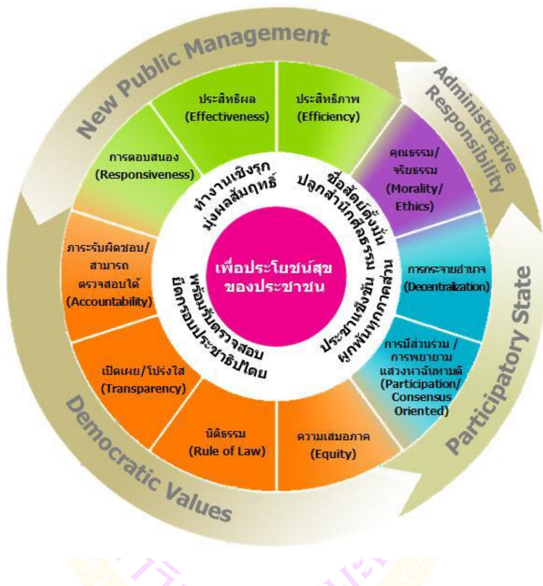
ภาพ 2 แสดงแผนภาพแสดงหลักธรรมาภิบาลของการบริหารกิจการบ้านเมืองที่ดี (GG Framework)

สรุปจากการศึกษาหลักธรรมาภิบาลของการบริหารกิจการบ้านเมืองที่ดี มีองค์ประกอบของการบริหารตามหลักธรรมาภิบาลจากหลาย ๆ องค์ประกอบทำให้พบว่า หลักการที่สำคัญของธรรมาภิบาลคือ การให้ความสำคัญกับการมีส่วนร่วมของทุกภาคส่วน ไม่ว่าจะเป็นภาครัฐ ภาคเอกชน และภาคประชาสังคมให้มีการดำเนินงานร่วมกันมีปฏิสัมพันธ์ซึ่งกันและกัน แต่หากมองในหลักการอื่นจะพบว่า ความเห็นจากองค์การระหว่างประเทศ นักวิชาการทั้งในประเทศไทยและต่างประเทศต่างก็ให้แนวคิดในองค์ประกอบของธรรมาภิบาล