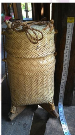
ภาพ 12 กระติบข้าว