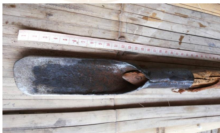
ภาพ 23 เสียม