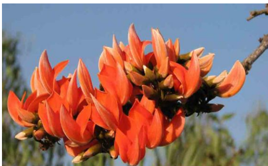
ภาพ 2 แสดงภาพดอกไม้ประจำจังหวัดลำพูน

ดอกไม้ประจำจังหวัดลำพูน คือ ดอกทองกวาว ( Butea monosperma )