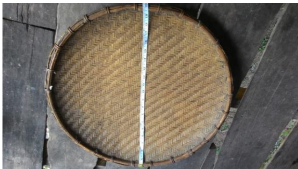
ภาพ 20 กระจดั่ง

กระจดั่งเป็นเครื่องมือใช้สอยที่ใช้ในชีวิตประจำวันของกะเหรี่ยงบ้านห้วยปิง ที่มีประโยชน์มาก เช่น ใช้ผัดข้าวหลังจากตำข้าวเปลือกจากครกมองของชาวกะเหรี่ยงแล้ว แต่ยังมีเปลือกข้าวที่เรียกว่า กาก ปะปนอยู่ จะต้องนำมาผัดด้วยกระจดั่ง ซึ่งต้องใช้ความชำนาญและการฝึกฝนเพื่อไม่ให้ข้าวสารหล่นออกจากกระจดั่ง กระจดั่งเป็นเครื่องมือใช้อย่างหนึ่งในประเพณีแต่งงานกะเหรี่ยงที่แสดงสัญลักษณ์ในด้านปรัชญาการดำเนินชีวิตของมนุษย์ ซึ่งกำลังจะเริ่มต้นขึ้น โดยนำลวดลายของกระจดั่งด้านหน้าและด้านหลังที่มีความแตกต่างกันมาเปรียบเทียบกับ การดำเนินชีวิตของมนุษย์ ด้านหน้าลวดลายของกระจดั่งเป็นคู่ ๆ หมายถึง การไม่เอาวัดเอาเปรียบกัน ส่วนด้านหลังมีการสานเป็นลวดลายกดทับกัน หมายถึงการเอาวัดเอาเปรียบ และกระจดั่งยังมีความเกี่ยวข้องกับคติความเชื่อของชาวกะเหรี่ยงที่ยึดถือสืบต่อกันมาแต่โบราณว่าหญิงกะเหรี่ยงที่ผัดข้าวเป็นมีความเป็นกุลสตรีในเรื่องงานบ้านงานเรือนและต้องแบกรับภาระหน้าที่หนักในการเตรียมอาหารการกินให้แก่ครอบครัว