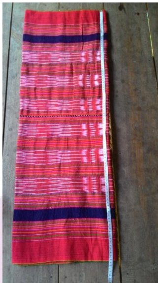
ภาพ 15 ซิ่นแต่งงาน

ซิ่น มาจากความเชื่อในเรื่องของสถานภาพการถูกจับจองและแต่งงานแล้ว ตามจารีตประเพณีบังคับให้หญิงที่แต่งงานสวมใส่ผ้าซิ่นทุกคน โดยกำหนดให้ผู้หญิงกะเหรี่ยงแสดงสัญลักษณ์ของการมีสามีด้วยการแต่งกายที่แตกต่างจากการเป็นสาวอย่างสิ้นเชิง ลักษณะการแต่งกายของสาวบริสุทธิ์จะแต่งกายด้วยชุดสีขาว ทรงกระสอบ ชุดไม่ค่อยมีลวดลายในตัวผ้ามาก ขณะที่หญิงที่แต่งงานแล้ว เลือกว่าผ้าซิ่นจะแยกออกจากกันเป็น 2 ท่อน ด้วยความเชื่อที่เปลี่ยนแปลงไม่ได้จึงสื่อให้เห็นว่าผู้หญิงที่แต่งงานนั้นเป็นฝ่ายที่ต้องทำหน้าที่สืบตระกูลและเป็นหัวหน้าในการประกอบพิธีกรรมต่าง ๆ ในครอบครัว ฉะนั้นผู้หญิงกะเหรี่ยงจึงมีหน้าที่รักษาจารีตประเพณีไม่ให้สูญหายหรือเสื่อมจากการผิดจารีตประเพณีซึ่งอาจเกิดจากความไม่รู้ หรือความผิดพลาดที่เป็นเหตุการณ์สุดวิสัย