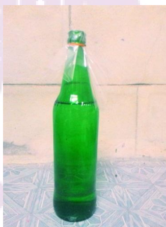
ภาพ 10 เหล้า

กะเหรียงบ้านห้วยปิงเชื่อว่า เหล้าเป็นเสมือนยารักษาโรค และขับไล่ความเจ็บป่วยของคู่บ่าวสาวในขณะที่กำลังจะแต่งงาน บริเวณภายในบ้าน หรือตัวเรือนที่มีเตาสำหรับบูชาผีบรรพบุรุษ เป็นการประกาศให้รู้ว่าบ่าวสาวคู่นี้มีสุขภาพที่สมบูรณ์เพื่อมีทายาทสืบตระกูลแล้ว ดา คำสา (ผู้ให้สัมภาษณ์, 4 มีนาคม 2558) ให้ข้อมูลว่าบ่าวสาวคู่นี้ได้ดื่มเหล้าจะมีความเจ็บป่วยมาเยือน ประวัติความเป็นมาของการใช้เหล้าในงานสำคัญแต่งงาน มีตำนานกล่าวว่าเมื่ออดีตมีสามเณรรูปหนึ่งอยู่ในศิลาในธรรม ไม่ยอมอมตะเหล้าหรืออบายมุขอื่น ๆ จนกระทั่งสึกออกมาได้แต่งงานมีเมียเหมือนชาวบ้านทั่วไป จนกระทั่งอายุ 40 ปี ก็ยังไม่มีลูก จู ๆ ก็มีอาการเจ็บป่วยโดยไม่รู้สาเหตุตามมาอีก ไปรักษากับหมอดคนใดไม่หาย อาการยิ่งทรุดลง วันหนึ่งเมื่อ