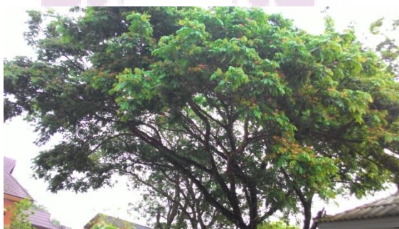
ภาพ 3 แสดงภาพต้นไม้ประจำจังหวัดลำพูน

ต้นไม้ประจำจังหวัดลำพูน คือ จามจุรี ( Samanea saman )