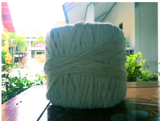
ภาพ 21 ฝ้ายมัดมือ