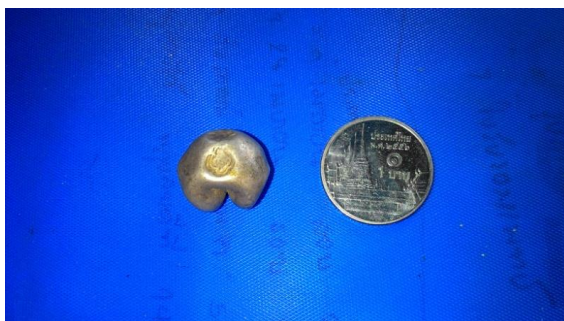
ภาพ 8 เงินก้อน