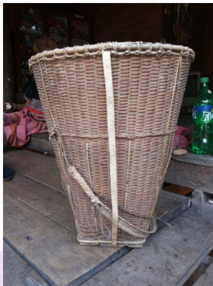
ภาพ 19 ตะกร้า

ด้วยวิถีชีวิตของกะเหรี่ยงผูกพันกับการใช้ชีวิตกับธรรมชาติเป็นส่วนใหญ่ การทำไร่บนดอยที่ต้องอาศัยการเดินทางด้วยเท้าเข้าไปยังสถานที่ทำการเพาะปลูก ความลำบากในการขนย้ายสิ่งของหลากหลายอย่างด้วยกัน ซึ่งหากถือหรือหิ้วก็เป็นการไม่สะดวกเท่าที่ควร กะเหรี่ยงรุ่นเก่าจึงได้คิดสร้างตะกร้าขึ้นมาเพื่อใช้หุนแรง เป็นอุปกรณ์ที่ชาวเขาเผ่ากะเหรี่ยงใช้ในการเก็บพืชผลทางการเกษตรหรือของป่าต่าง ๆ ในเวลาเดินทางกลับบ้าน กะเหรี่ยงห้วยปิงเรียกว่า “ก้อ” ทำมาจากไม้ไผ่ที่มีความแข็งแรงและหนา จักสานแบบละเอียดมีความคงทนสามารถใช้ได้นาน นอกจากนี้ยังใช้เก็บเสื้อผ้า เก็บเมล็ดข้าว ข้าวโพด เพราะมีความถี่ ไม้รั้ว สามารถเก็บวัสดุต่าง ๆ ได้อีกหลาย ด้านคติความเชื่อในการนำตะกร้ามาใช้ในพิธีแต่งงานของกะเหรี่ยงเชื่อว่า ตะกร้าเป็นสิ่งที่ใช้เก็บสิ่งต่าง ๆ ซึ่งจะช่วยเพิ่มพูนสิ่งต่าง ๆ ที่เป็นความจำเป็นต่อการดำรงชีวิตในครอบครัวให้มีจำนวนที่มากขึ้นอันจะทำให้มีชีวิตความเป็นอยู่ที่ดี ไม่ขัดสน