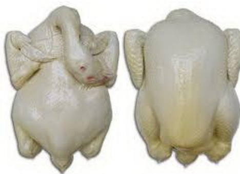
ภาพ 9 ไก่คู่