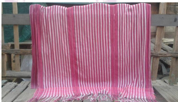
ภาพ 18 ผ้าห่ม