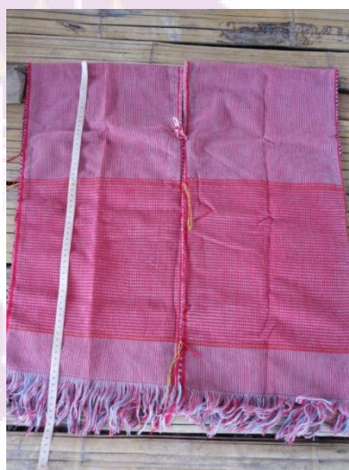
ภาพ 14 เสื้อเจ้าป่าว

ดา คำสา (ผู้ให้สัมภาษณ์, 4 มีนาคม 2558) กล่าวว่า ลักษณะของเสื้อเจ้าป่าวแขนจะสั้นเพื่อให้สะดวกในเวลาทำงาน และสีของเสื้อจะไม่มีกฏตายตัวใช้สีใดก็ได้ แต่ชายกะเหรี่ยงบ้านห้วยปิง มักนิยมสวมใส่เสื้อสีชมพูปนแดง เสื้อเจ้าป่าวจะถูกสวมใส่เฉพาะในพิธีกรรมสำคัญ 2 พิธีกรรม คือ ประเพณีแต่งงาน และประเพณีเลี้ยงผีบรรพบุรุษ เสื้อของเจ้าป่าวจึงเป็นสัญลักษณ์ที่สื่อถึงความเป็นผู้ชายเต็มตัว