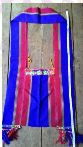
ภาพ 13 ย่าม