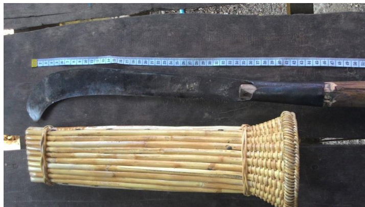
ภาพ 22 มีด