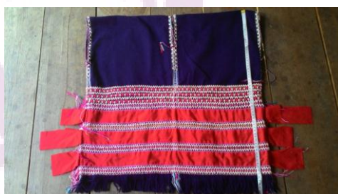
ภาพ 11 เลื่อมะเดือย

เลื่อมะเดือยของหญิงกะเหรี่ยงบ้านห้วยปิง เป็นเสื้อที่ใช้ในงานพิธี ซึ่งนิยมตัดเย็บให้พื้นหลังเป็นสีดำ หรือสีน้ำเงิน คาดแถบสีแดง 3 แถบ และปักลูกมะเดือย ด้วยคติความเชื่อของสีและวัสดุในการถักเย็บเสื้อดังนี้