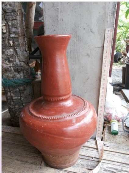
ภาพ 17 น้ำตัน

กะเหรี่ยงมีความเชื่อว่าชนชาติพันธุ์กะเหรี่ยงถือกำเนิดมาจากน้ำเต้า ดังนิทานที่ดา คำสา (ผู้ให้สัมภาษณ์, 4 มีนาคม 2558) เล่าให้ฟังว่า มนุษย์ทั้งโลกมีพ่อแม่คนเดียวกัน ด้วยว่าสมัยก่อนเกิดไฟไหม้แผ่นดินบนโลก เทวดาบนสวรรค์เห็นดังนั้นเกิดความสงสาร จึงได้เปล่งเสียงออกมาว่า ให้เหลือคนบนโลกนี้เป็นหญิง 1 คน ชาย 1 คน เมื่อเวลาผ่านไป ชายหญิงคู่นี้ต่างซัดเซพเนจรเดินทางไปเรื่อย ๆ จนวันหนึ่งเดินทางมาอยู่ใกล้ ๆ กัน ณ ริมห้วยคนละฝั่ง ฝ่ายหญิงนอนบนต้นไม้ทางทิศตะวันออก ฝ่ายชายนอนบนต้นไม้ฝั่งทิศตะวันตก ครั้นเวลาเช้าต่างฝ่ายต่างลงมาจากต้นไม้เพื่อที่จะล้างหน้า ต่างประสบบพบหน้ากัน ฝ่ายชายก็ถามว่าน้องมาจากไหน ฝ่ายหญิงก็ตอบว่ามาจากทิศตะวันออก พุดคุยซักถามกันสักครู่ก็พากันมาสร้างบ้านเรือนอยู่ด้วยกัน เพื่อให้เป็นหลักแหล่ง ความใกล้ชิดสนิทสนมทำให้ทั้งคู่ตกลงที่จะครองคู่เป็นครอบครัวเดียวกัน เวลาผ่านไปฝ่ายหญิงได้ตั้งท้องและคลอดลูกออกมา ซึ่งปรากฏว่าไม่ใช่คนแต่เป็นน้ำเต้า (ปะน้า) 1 ลูก ฝ่ายชายบอกว่าจะเอาน้ำเต้านี้ไปบูชาบนหินเหนือน้ำตก เพราะไม่ใช่ลูกคนแต่เป็นน้ำเต้า เมื่อเอาน้ำเต้าไปวางแล้วต่างพากันกลับบ้าน คืนนั้นฝนตกลงมาอย่างหนัก ได้พัดพาน้ำเต้าลอยลงมายังบ้านของคู่สามีภรรยา นั้น โดยไหลมาอย่างแรงตามกระแส น้ำที่กระทบกับหินทำให้น้ำเต้าแตกออก ทันใดนั้นก็มียักษ์ออกมาจากน้ำเต้ามีจำนวนถึง 101 คน ส่งเสียงร้องไห้แงง สามีภรรยาที่อยู่บนบ้านได้ยินเสียงก็แปลกใจจึงลงมาดูและพบเด็กทารก ก็แปลกใจว่าเด็กมา