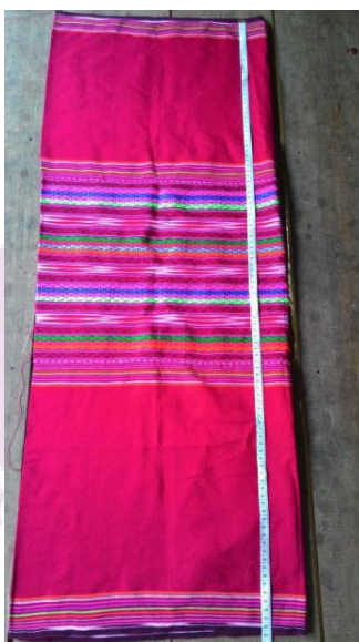
ภาพ 16 ซิ่นเข้าหอ

ลวดลายดั้งเดิมของชุดที่ได้รับการถ่ายทอดมา ฉะนั้นผ้าซิ่นของกะเหรี่ยงบ้านหัวปิงจึงมีลักษณะเดียวกันหมดทุกครัวเรือน เจ้าสาวต้องเก็บรักษาผ้าซิ่นผืนนี้ไว้ตราบจนถึงลูกหลาน เพราะเชื่อว่าเมื่อเวลาผ่านไปให้นำซิ่นมาตัดเป็นซิ่นเล็ก ๆ มอบไว้ให้แก่ลูกหลาน จะเกิดความปลอดภัยแก่ตัวคนที่ครองผ้าไว้ โดยเฉพาะอุบัติเหตุ หรือเวลาเผชิญเหตุการณ์อันตรายที่ไม่ได้คาดคิด