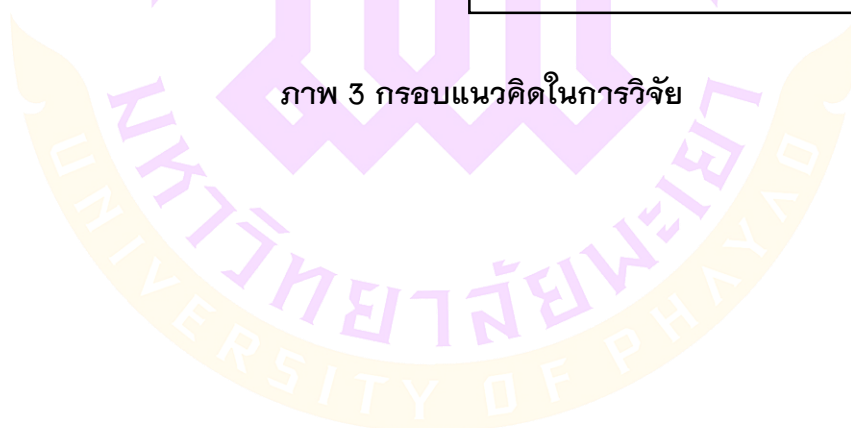
ภาพ 3 กรอบแนวคิดในการวิจัย