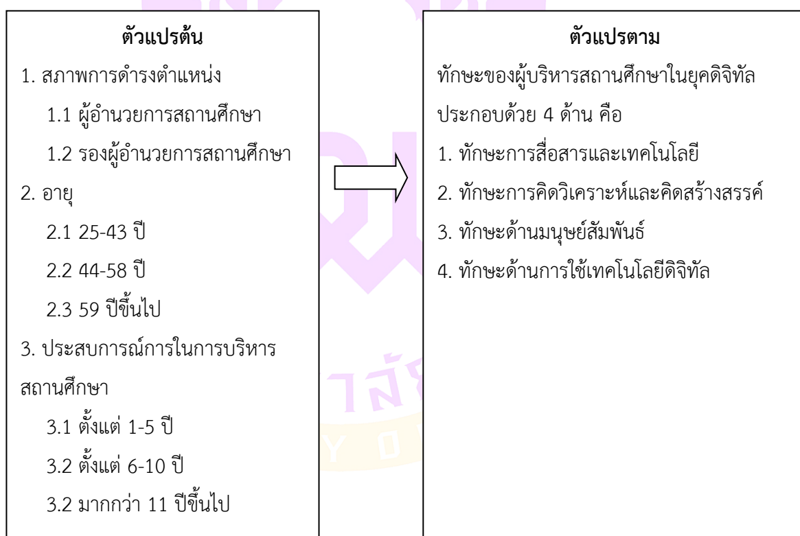
ภาพ 1 แสดงกรอบแนวคิดการวิจัย

การวิจัยครั้งนี้ผู้วิจัยได้กำหนดกรอบแนวคิดการวิจัยเพื่อการศึกษาทักษะของผู้บริหารสถานศึกษาในยุคดิจิทัล ดังนี้