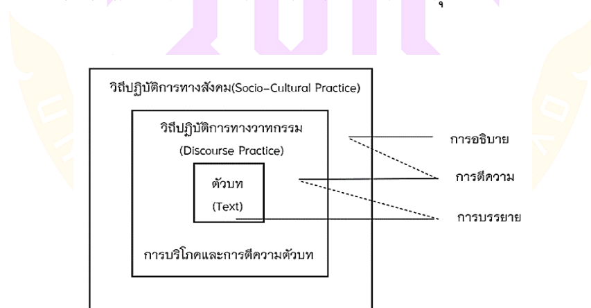
ภาพ 1 แสดงกรอบวาทกรรมวิเคราะห์เชิงวิพากษ์ ของ Norman Fairclough

มิติของวิถีปฏิบัติทางสังคมและวัฒนธรรม (Socio-Cultural Practice) เป็นการวิเคราะห์ ความสัมพันธ์ทางสังคม วัฒนธรรม ความคิด ความเชื่อ กับอุดมการณ์