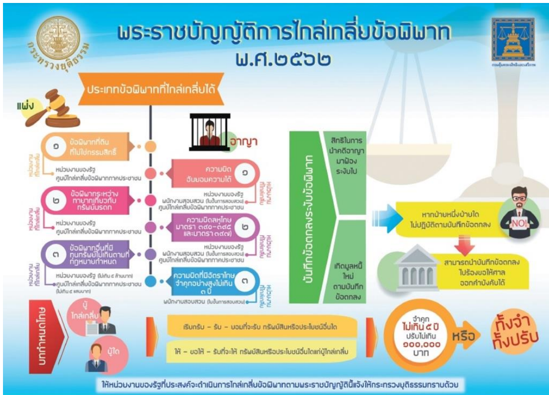
ภาพ 1 ประเภทข้อพิพาทที่ไกล่เกลี่ยได้ตามพระราชบัญญัติการไกล่เกลี่ยข้อพิพาท พ.ศ. 2562