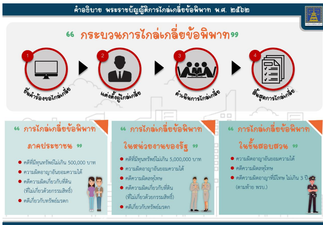
ภาพ 2 หน่วยงานที่ทำหน้าที่ไกล่เกลี่ยข้อพิพาทตามพระราชบัญญัติการไกล่เกลี่ยข้อพิพาท พ.ศ. 2562