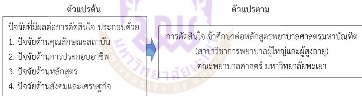
ภาพ 1 กรอบแนวคิดการวิจัย

จากการศึกษางานวิจัยที่เกี่ยวข้อง พบว่า ปัจจัยที่มีผลต่อการตัดสินใจ ประกอบด้วย ปัจจัยด้านคุณลักษณะสถาบัน ปัจจัยด้านการประกอบอาชีพ ปัจจัยด้านหลักสูตร และปัจจัยด้านสังคมและเศรษฐกิจ ดังนั้น ในการศึกษาปัจจัยที่มีผลต่อการตัดสินใจเข้าศึกษาต่อหลักสูตรพยาบาลศาสตรมหาบัณฑิต (สาขาวิชาการพยาบาลผู้ใหญ่และผู้สูงอายุ) คณะพยาบาลศาสตร์ มหาวิทยาลัยพะเยา จึงกำหนดกรอบแนวคิดการวิจัย ดังนี้