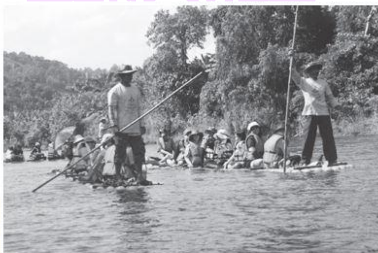
ภาพ 2 การจัดการการใช้ประโยชน์ของพื้นที่