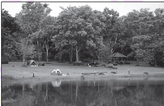
ภาพ 1 ศักยภาพแหล่งท่องเที่ยวเชิงนิเวศ

ในการประเมินมาตรฐานแหล่งท่องเที่ยวเชิงนิเวศ องค์ประกอบในเรื่องของศักยภาพของแหล่งท่องเที่ยว ในการที่จะจัดการท่องเที่ยวเชิงนิเวศ นับว่ามีความสำคัญที่สุด ซึ่งแหล่งท่องเที่ยวเชิงนิเวศควรจะเป็นแหล่งธรรมชาติที่สามารถก่อให้เกิดความพอใจในการเรียนรู้และสัมผัสกับระบบนิเวศ อาจจะมี ความเกี่ยวข้องกับวัฒนธรรมท้องถิ่น เพื่อให้ นักท่องเที่ยวได้เรียนรู้ลักษณะวัฒนธรรมที่มีวิถีชีวิตแบบธรรมชาติ หรือเป็นส่วนหนึ่งในระบบนิเวศของแหล่งท่องเที่ยว นั้น ๆ นอกจากนี้ การคำนึงถึงความปลอดภัยของนักท่องเที่ยวเป็นสิ่งหนึ่งที่สำคัญในการจัดการท่องเที่ยวเชิงนิเวศในแหล่งธรรมชาติ จากแนวคิดดังกล่าว ศักยภาพของแหล่งธรรมชาติในการเป็นแหล่งท่องเที่ยวเชิงนิเวศจึงสามารถสรุปดัชนีมาตรฐานคุณภาพได้ 4 ดัชนี ได้แก่ 1) แหล่งธรรมชาติมีจุดดึงดูดด้านการท่องเที่ยวและเรียนรู้ 2) มีความอุดมสมบูรณ์ของแหล่งธรรมชาติ 3) แหล่งธรรมชาติมีความเกี่ยวข้องกับวัฒนธรรมท้องถิ่น 4) ความปลอดภัยของแหล่งธรรมชาติในการท่องเที่ยว