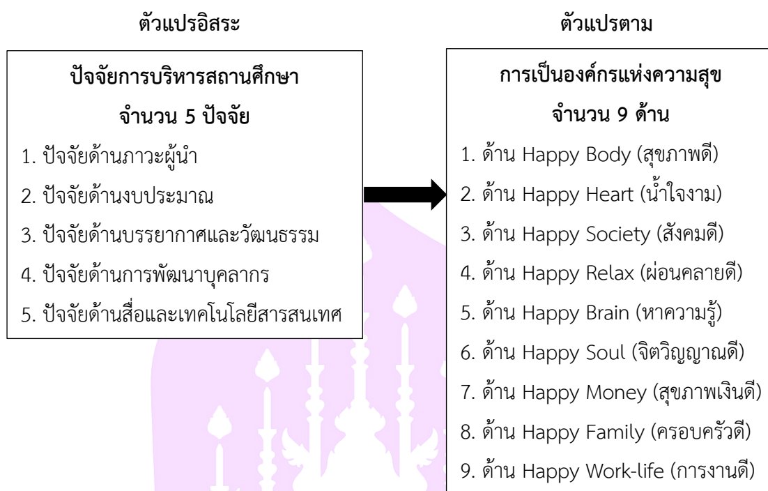
ภาพ 1 กรอบแนวคิดงานวิจัยปัจจัยการบริหารสถานศึกษาที่ส่งผลต่อการเป็นองค์กรแห่งความสุข สังกัดสำนักงานเขตพื้นที่การศึกษามัธยมศึกษาพะเยา