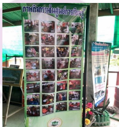
ภาพ 9 กิจกรรมการจัดการขยะ