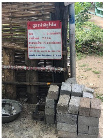
ภาพ 11 การทำอิฐมวลเบาจากไฟ