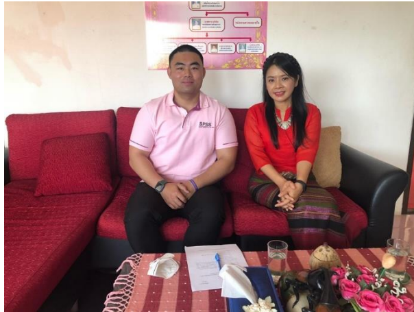
ภาพ 3 การสัมภาษณ์นายกเทศมนตรีเทศบาลตำบลกะลา