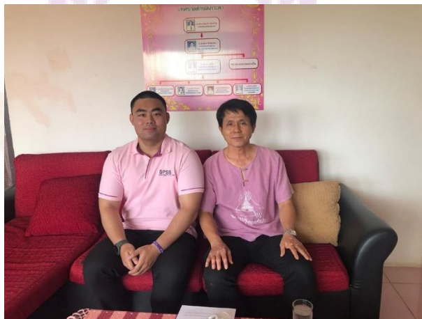
ภาพ 4 การสัมภาษณ์รองปลัดเทศบาลตำบลกะลา