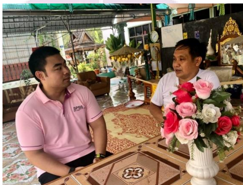
ภาพ 6 การสัมภาษณ์ประธานกลุ่มกิจกรรมการจัดการขยะ