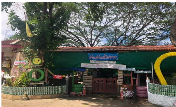
ภาพ 8 ร้านค้าแต่ไม่ขาย