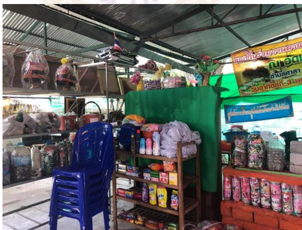
ภาพ 10 เครื่องอุปโภค บริโภค ที่สามารถนำขยะมาแลกได้