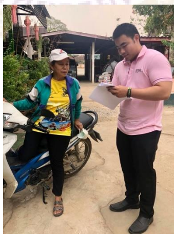
ภาพ 7 การแจกแบบสอบถามประชาชน