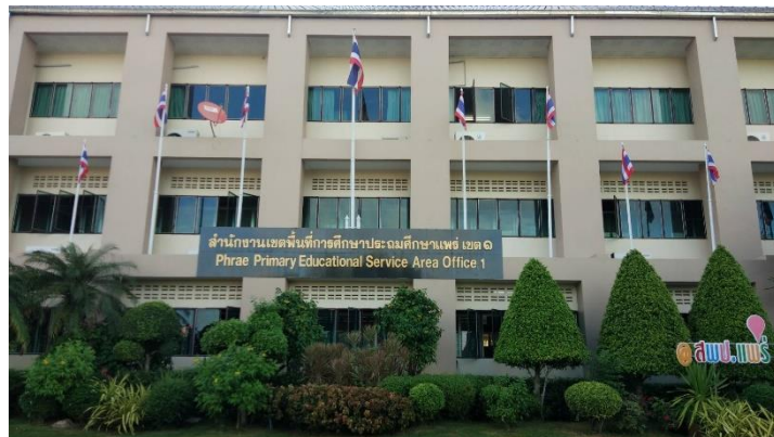
ภาพ 1 แสดงสำนักงานเขตพื้นที่การศึกษาประถมศึกษาแพร่ เขต 1