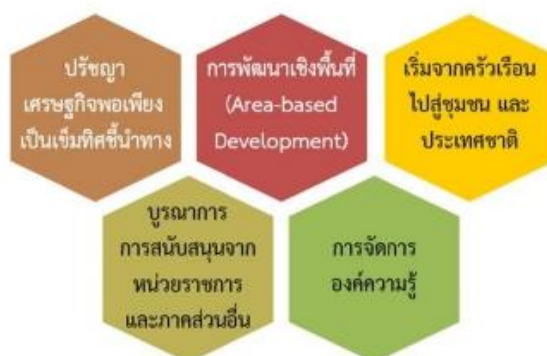
ภาพ 2 แสดงแนวคิดพื้นฐานในการขับเคลื่อนปรัชญาของเศรษฐกิจพอเพียง

ศรประภา พงษ์หัตถาศิลป์ กล่าวว่า การนำแนวทางหลักปรัชญาของเศรษฐกิจพอเพียง มาขับเคลื่อนสู่สถานศึกษา เพื่อประยุกต์ใช้ในการจัดการเรียนการสอน การจัดกิจกรรมพัฒนาผู้เรียน และการบริหารการสถานศึกษา เพื่อให้เกิดผลในทุกระดับได้อย่างมีประสิทธิภาพและมีประสิทธิผล เกิดการเปลี่ยนกระบวนทัศน์ ส่งผลสู่การดำเนินชีวิตบนพื้นฐานของหลักปรัชญาของเศรษฐกิจพอเพียง ของผู้เรียน ผู้บริหาร ครูและบุคลากรทางการศึกษาอย่างต่อเนื่อง (ศรประภา พงษ์หัตถาศิลป์, 2557, หน้า 26)