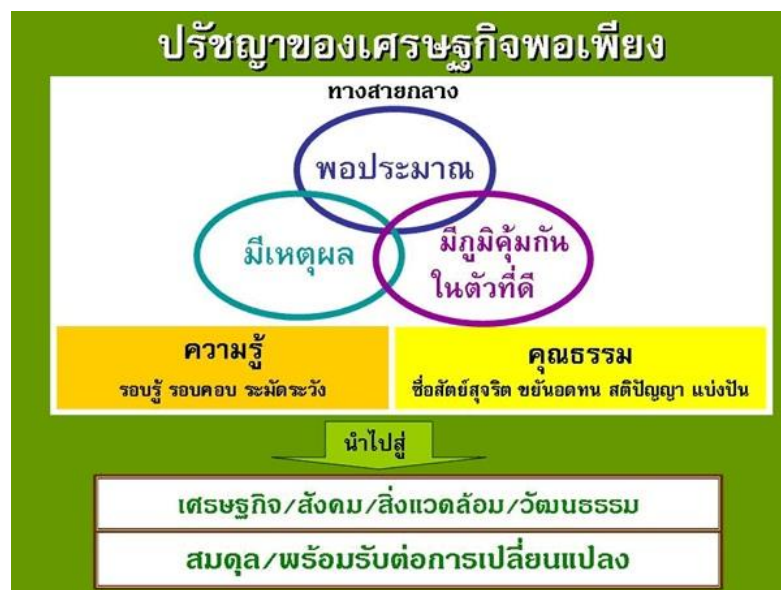
ภาพ 1 แสดงปรัชญาของเศรษฐกิจพอเพียง

สุรีพร เอี้ยวถาวร กล่าวว่า ปรัชญาของเศรษฐกิจพอเพียง หมายถึง แนวทางการดำเนินชีวิตและการปฏิบัติตน ที่พระบาทสมเด็จพระเจ้าอยู่หัวมีพระราชดำรัสชี้แนะแก่พสกนิกรชาวไทย เป็นการพัฒนาที่ตั้งอยู่บนพื้นฐานของทางสายกลาง และความไม่ประมาท โดยคำนึงถึงความพอประมาณ ความมีเหตุผล การสร้างภูมิคุ้มกันที่ดีในตัวเอง ตลอดจนใช้ความรู้ ความรอบคอบ และคุณธรรม ประกอบกับการวางแผน การตัดสินใจ และขณะเดียวกันจะต้องเสริมสร้างพื้นฐานจิตใจให้มีสำนึกในคุณธรรม ความซื่อสัตย์สุจริต ให้มีความรอบรู้ที่เหมาะสม ดำเนินชีวิตด้วยความอดทน ความเพียร มีสติปัญญา และความรอบคอบ เพื่อให้สมดุลและพร้อมต่อการรองรับการเปลี่ยนแปลงอย่างรวดเร็วและกว้างขวาง ทั้งด้านวัตถุ สังคม สิ่งแวดล้อม วัฒนธรรมจากโลกภายนอก ได้เป็นอย่างดี (สุรีพร เอี้ยวถาวร, 2550, หน้า 10)