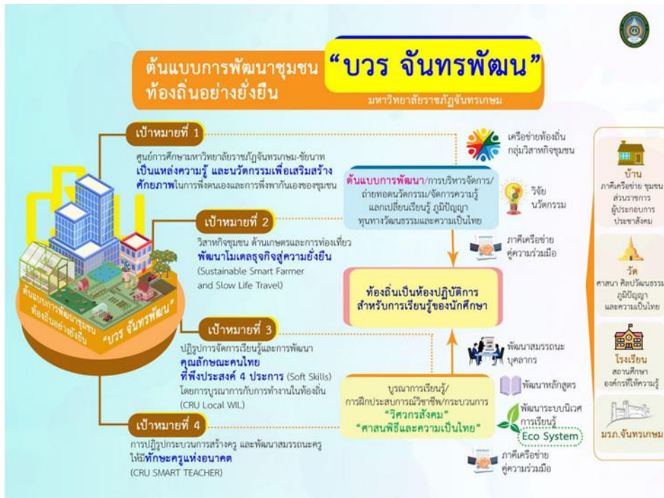
ภาพ 2 ต้นแบบการพัฒนาชุมชนท้องถิ่นอย่างยั่งยืน “บวร จันทรพัฒน์”