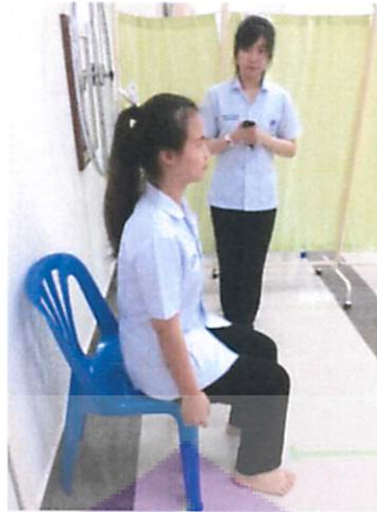
รูปที่ 1 ทำเริ่มต้นของการทดสอบ FTSSST