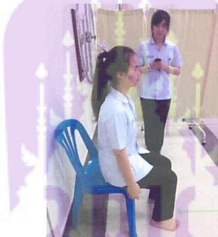
รูปที่ 4 ท่าเริ่มต้นของการทดสอบ TTSWT

จะให้อาสาสมัครนั่งบนเก้าอี้ไม่มีที่พนักแขนที่มีความสูงเหมาะสมโดยพิจารณาจากลักษณะการนั่งของอาสาสมัคร คือเมื่ออาสาสมัครนั่งหลังตรง และวางส้นเท้าอยู่หลังต่อข้อเข่าประมาณ 10 เซนติเมตร แล้วข้อสะโพกต้องอยู่ในลักษณะงอประมาณ 90 องศา วางแขนไว้ข้างลำตัว จากนั้นให้อาสาสมัครลุกขึ้นและนั่งลงให้เร็วที่สุดและปลอดภัย 3 ครั้งต่อเนื่องกัน และในครั้งที่ 3 หลังจากอาสาสมัครลุกขึ้นแล้ว ให้อาสาสมัครเดินไปข้างหน้า 3 เมตรแล้วเลี้ยวกลับมาที่นั่งเดิม เริ่มจับเวลาเมื่อผู้ประเมินบอก “เริ่ม” และ “หยุด” เวลาเมื่ออาสาสมัครกลับนั่งลงหลังชิดพนักพิงเก้าอี้ ทำการทดสอบทั้งหมด 3 รอบ โดยแต่ละรอบมีระยะพัก 2 นาที