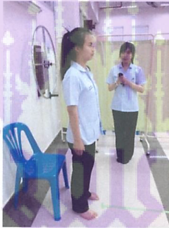
รูปที่ 2 ขณะยืนในการทดสอบ FTSSST ข้อเข่า ข้อสะโพกต้องเหยียดตรง