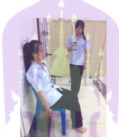
รูปที่ 7 ทำสุดท้ายของการทดสอบ TTSWT