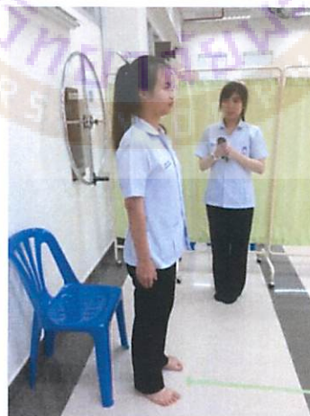
รูปที่ 5 ขณะยืนในการทดสอบ TTSWT ข้อเข่า ข้อสะโพกต้องเหยียดตรง