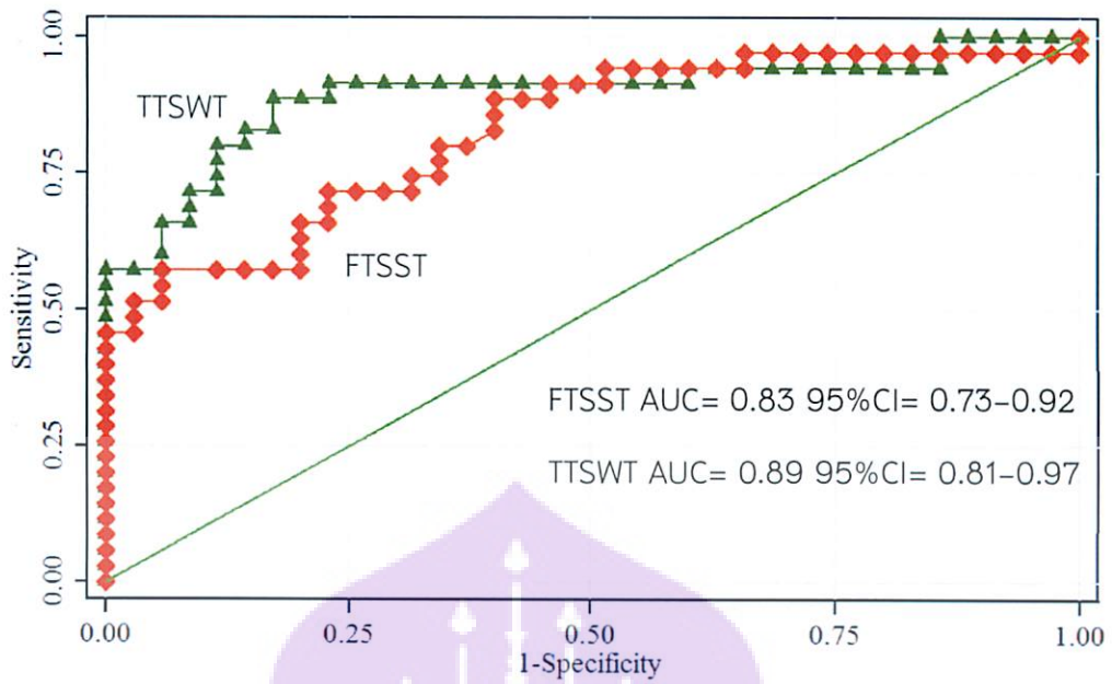
รูปที่ 8 พื้นที่ใต้กราฟ (Area under ROC curve) ของการทดสอบ FTSST และ TTSWT