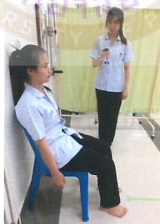
รูปที่ 3 ทำสุดท้ายของการทดสอบ FTSSST