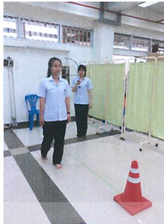
รูปที่ 6 เดินไปกลับรวม 6 เมตร