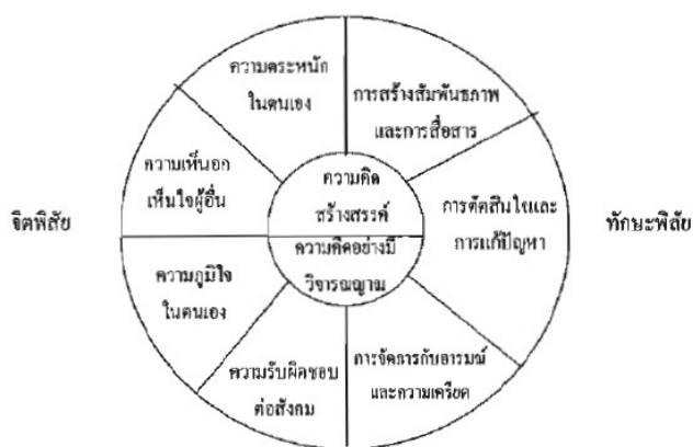
ภาพ 1 องค์ประกอบของทักษะชีวิต กรมสุขภาพจิต กระทรวงสาธารณสุข, 2541

แนวคิดของ ฆงยุทธ วงศ์ภิรมณ์ศานต์ (2539) ได้เปลี่ยนแนวคิดขององค์การอนามัยโลกให้เหมาะสมกับประเทศไทย ได้มีการปรับเปลี่ยนโดยจัดความคิดสร้างสรรค์ ความคิดวิเคราะห์ วิเคราะห์เป็นองค์ประกอบร่วมและเป็นพื้นฐานของทุกองค์ประกอบอีกทั้งได้จัดความตระหนักรู้ในตนเองและความเห็นใจผู้อื่น เป็นด้านจิตพิสัย โดยเพิ่มเจตคติอีก 1 คู่ คือความภูมิใจในตนเอง (Self-Esteem) และความรับผิดชอบต่อสังคม (Social Responsibility) รวมเป็นองค์ประกอบ 12 องค์ประกอบ จัดเป็น 6 คู่ ดังแสดงในภาพประกอบ 1 (กระทรวงสาธารณสุข กรมสุขภาพจิต, 2541 หน้า 1)