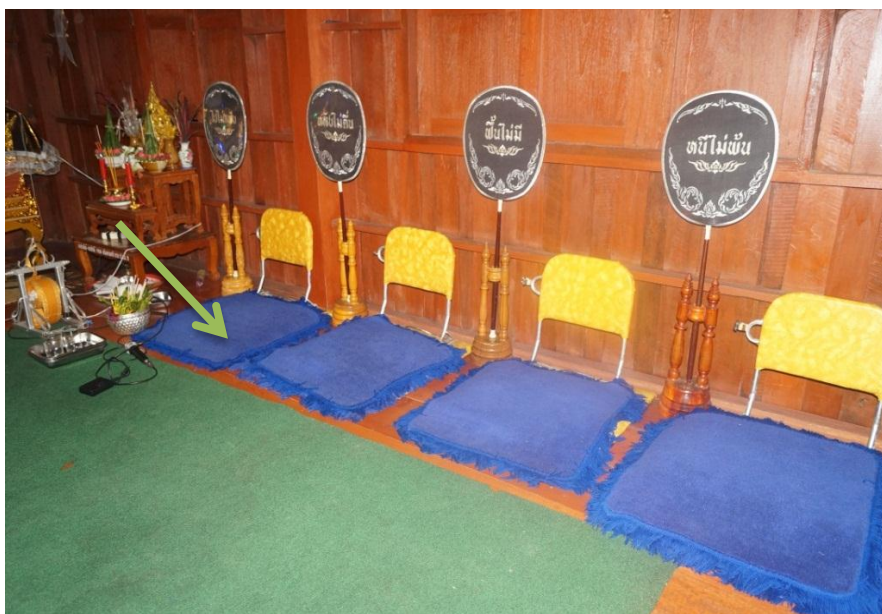
ภาพ 3 อาสนะสงฆ์ในพิธีสวดพระอภิธรรมศพ

ส่วนพระสงฆ์ที่จะนั่งสวดพระอภิธรรม รวมถึงพระสงฆ์ที่จะเป็นองค์เทศนาธรรมจะนั่งอยู่กับอาสนะลำดับที่ 1 ถึง 4 ตามลำดับพรรษาของพระสงฆ์ เว้นแต่ว่าคืนไหนเจ้าภาพจะนิมนต์พระนักเทศน์ต่างอำเภอ ต่างจังหวัดอื่นมาเทศนาธรรมจะต้องมีการจัดอาสนะสงฆ์ไว้อีกหนึ่งซึ่งจำเป็นต้องใช้ธรรมาสน์ด้วย สามารถสังเกตได้ว่าพระสงฆ์ที่เป็นองค์เทศน์ แม้จะมีอายุพรรษาน้อยก็ตามจะได้รับเกียรติให้นั่งบนอาสนะในธรรมาสน์เสมอ และผู้ร่วมพิธี แม้กระทั่งพระสงฆ์ที่สวดพระอภิธรรมต้องพนมมือฟังเทศนาธรรมด้วยความเคารพเป็นการเพิ่มความศักดิ์สิทธิ์ให้กับพิธีกรรมมากยิ่งขึ้น