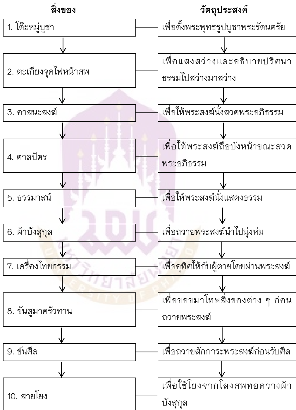
ตาราง 1 แสดงแผนภูมิ สิ่งของต่าง ๆ ที่ใช้ประกอบพิธีสวดพระอภิธรรมและ วัตถุประสงคืที่ใช้

จากที่กล่าวมาทั้งหมดนี้ สิ่งของต่าง ๆ ที่ใช้ประกอบพิธีสวดพระอภิธรรมและ วัตถุประสงคืที่ใช้ สามารถสรุปได้ ตามตารางแสดงแผนภูมิต่อไปนี้