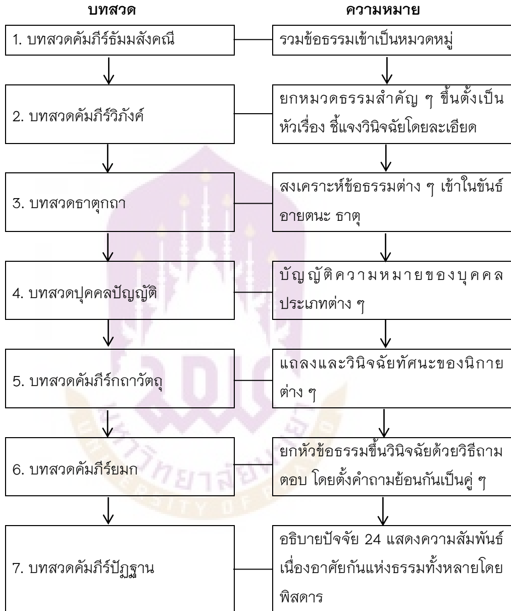
ตาราง 2 แสดงแผนภูมิ บทสวดพระอภิธรรมเจ็ดคัมภีร์และความหมาย

จากที่กล่าวมาทั้งหมดนี้บทสวดพระอภิธรรมเจ็ดคัมภีร์และความหมาย สามารถสรุปได้ ตามตารางแสดงแผนภูมิต่อไปนี้