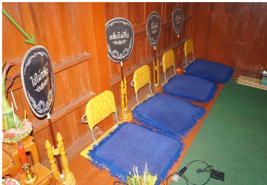
ภาพ 4 ตาลปัตรในพิธีสวดพระอภิธรรมศพ