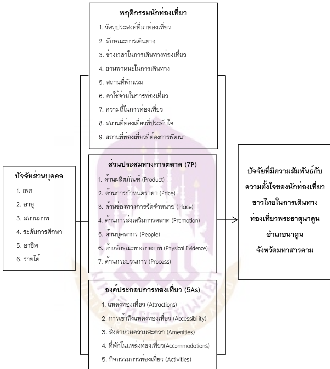
ภาพ 3 กรอบแนวคิดการวิจัย