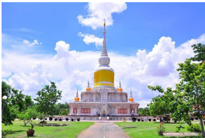
ภาพ 2 พระธาตุนาคูน อำเภอนาคูน จังหวัดมหาสารคาม

ที่มา: (ชมรมสงวนพระธาตุนาคูนแห่งประเทศไทย, 2560)