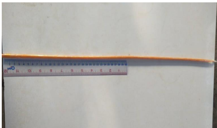
ภาพ 12 แสดงเทียนเวียนหัว

4.1.5 เทียนเวียนหัว เป็นเทียนที่มีความยาวเท่ากับรอบศีรษะ สำหรับให้ ประธานสงฆ์จุดทำน้มนต์จำนวน 1 เล่ม