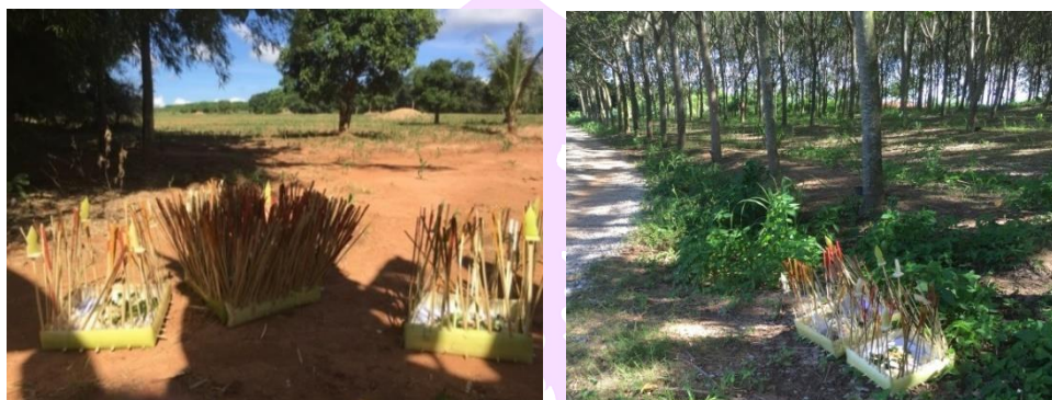
ภาพ 52 แสดงกระทงที่ผ่านพิธีกรรมเซ็ดเวียกหมู่บ้านแล้วถูกนำไปตั้งนอกหมู่บ้าน

นอกทั้ง 8 กระทงรวมทั้งกระทงเก้าห้องอีก 1 กระทงให้แหล่งกระจาย ตามความเชื่อว่าเป็นการยิงเคราะห์ทั้งหลายให้หมดสิ้นไป แต่ในปัจจุบันเนื่องจากการยิงปืนหรือมีปืนไว้ครอบครองเป็นสิ่งผิดกฎหมาย จึงทำให้การยิงปืนส่งและยิงกระทงหายไป (สุนีย์ พิมพ์สารี, ผู้ให้สัมภาษณ์, วันที่ 6 มิถุนายน 2560)