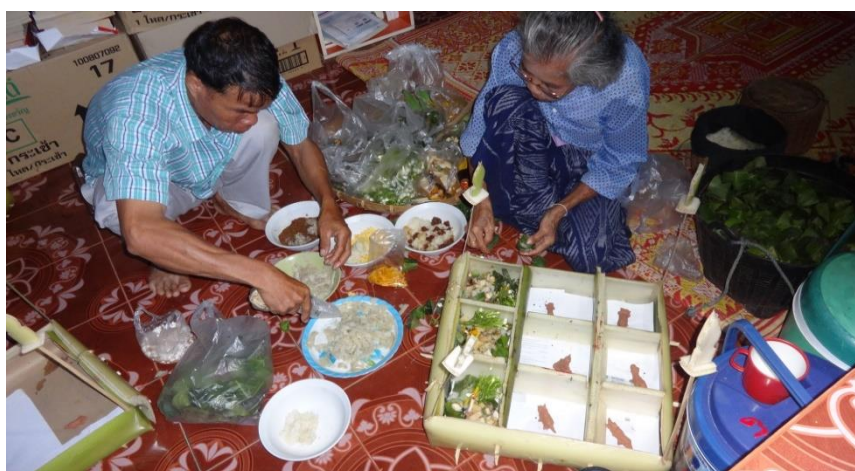
ภาพ 47 แสดงการนับเครื่องบูชาและเครื่องเซ่นไหว้ใส่ลงในกระทง

1.2 การนับเครื่องบูชาและเครื่องเซ่นไหว้ใส่ลงในกระทง ในการนับเครื่องบูชาและเครื่องเซ่นไหว้ลงในกระทงจะต้องนับใส่ให้ถูกต้องตามจำนวนโดยมัคนายกจะเป็นผู้คอยให้คำปรึกษาและดูแลในส่วนนี้