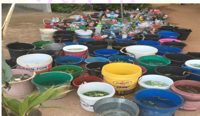
ภาพ 48 แสดงคุดทรายแฉ่และคูน้ำมนต์ ของชาวบ้านแต่ละครอบครัว

1.7 การเตรียมคุดทรายแฉ่ และคูน้ำมนต์ ชาวบ้านแต่ละครัวเรือนจะนำมาวางไว้ข้างเต็นท์ปะรำพิธี ซึ่งคุดทรายแฉ่นั้นหลังจากที่ผ่านพิธีกรรมแล้วจะนำกลับไปหว่านรอบบ้านที่อาศัยของตนเอง ในส่วนคูน้ำมนต์เพื่อทำน้ำมนต์สำหรับนำกลับไปอาบที่บ้าน