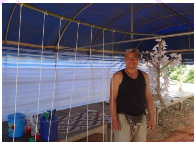
ภาพ 19 แสดงฝ่ายชะตาบ้าน

4.5 ฝ่ายชะตาบ้าน คือด้ายสายสัญญาณที่มัดห้อยไว้กับไม้ไผ่ตรงข้ามโต๊ะหมู่และประธานสงฆ์ ซึ่งมีจำนวนทั้งหมด 7 เส้น ความยาวประมาณ 1 วา มัดเรียงกันไว้ห่างกันเส้นละประมาณ 1 คืบ