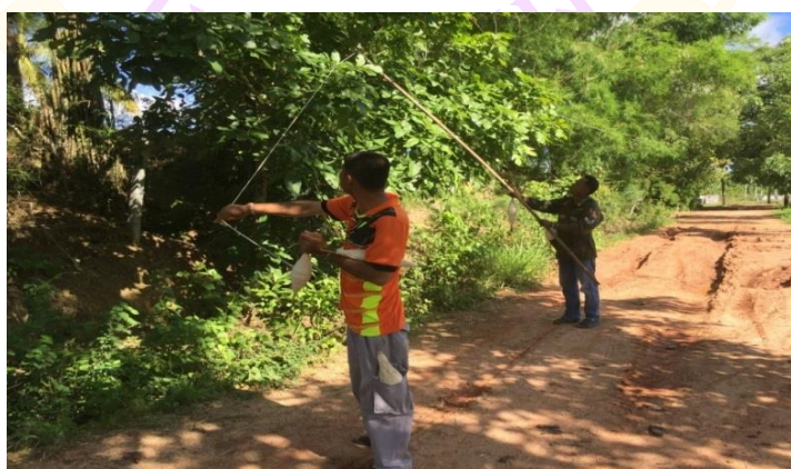
ภาพ 53 แสดงการล้อมด้ายสายสิญจน์รอบทั้งหมู่บ้าน

2.11 ขั้นตอนการล้อมฝ้ายล้อมบ้าน (สายสิญจน์สำหรับรอบหมู่บ้าน) เป็นขั้นตอนสุดท้ายของพิธีกรรมเซ็ดเวียกหมู่บ้าน หลังจากที่ตั้งกระทงแต่ละประเภทแล้ว ชาวบ้านที่มีหน้าที่ในการนำด้ายสายสิญจน์ที่ผ่านพิธีกรรมแล้ว จะนำด้ายสายสิญจน์มาล้อมรอบทั่วทั้งหมู่บ้านเพื่อเป็นการป้องกันสิ่งชั่วร้ายทั้งหลายและป้องกันเคราะห์ทั้งหลายไม่กลับเข้ามาในหมู่บ้านได้อีก ซึ่งมีข้อปฏิบัติอยู่ว่าด้ายสายสิญจน์ที่ล้อมรอบหมู่บ้านนั้นจะต้องให้สูงกว่าระดับศีรษะ ภายในสามวันไม่ให้ขาดออกจากกัน (ประเสริฐ วังศิริ, ผู้ให้สัมภาษณ์, วันที่ 6 มิถุนายน 2560)