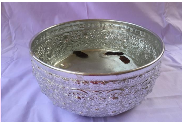
ภาพ 14 แสดงชั้นใส่น้ำเพื่อทำน้มนต์

4.1.7 ชั้นใส่น้ำเพื่อทำน้มนต์ ในชั้นน้ำใส่ผลส้มป่อยเผาไฟลงไปจำนวน 3 ผล ส้มป่อยเป็นผลของพืชชนิดหนึ่งที่เป็นไม้พุ่มรอเลื้อย มีหนามแข็ง