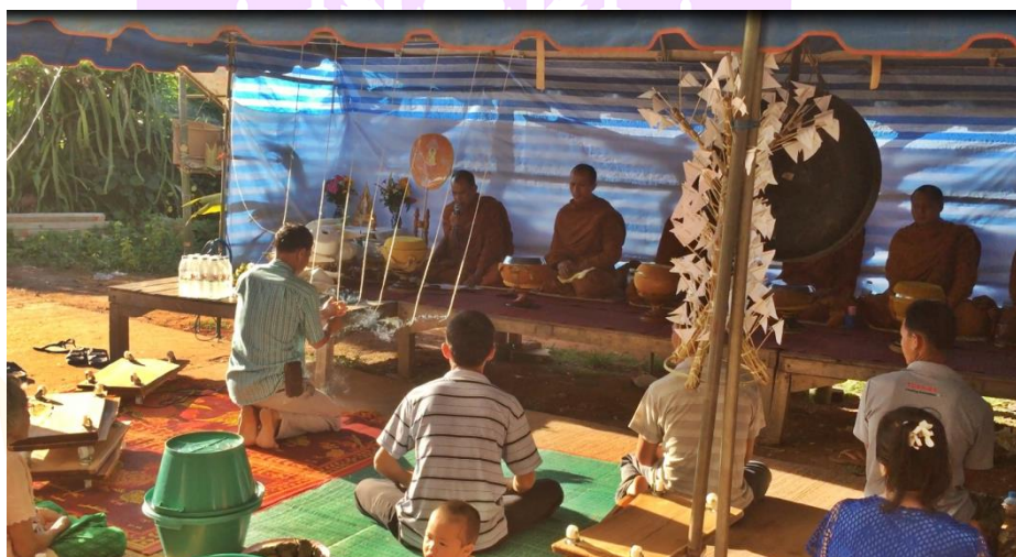
ภาพ 50 แสดงมีคนายกกำลังจุดฝ้ายต่อชะตาบ้าน

2.6 ขั้นตอนการต่อชะตาบ้าน เป็นขั้นตอนที่กระทำในขณะที่พระสงฆ์แสดงพระธรรมเทศนา มีคนายกใช้ไฟจุดฝ้ายต่อชะตาบ้านจำนวน 7 เส้น ที่มีดเรียงไว้ใกล้บริเวณหน้าโต๊ะหมู่บูชา ไปจนกว่าด้ายนั้นจะไหม้หมด