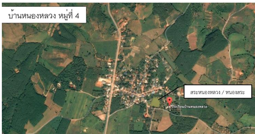
ภาพ 6 แสดงพื้นที่วิจัย

ทิศตะวันตก ติดกับบ้านนาเปี้ย หมู่ที่ 7 ตำบลนาหอ อำเภอด่านซ้าย จังหวัดเลย