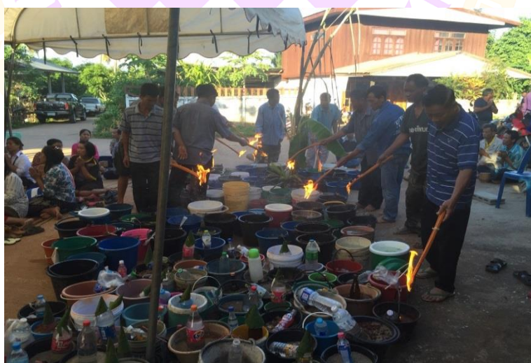
ภาพ 49 แสดงการทำน้ำมนต์สำหรับชาวบ้านนำไปอาบ

2.3 ขั้นตอนการทำน้ำมนต์ ในขณะที่ประกอบพิธีกรรมเมื่อพระสงฆ์เจริญพระพุทธมนต์ถึงบทมงคลสูตร บทคาถาว่า อเสวนา จะ พาลานัง... ผู้ใหญ่บ้านจุดเทียนน้ำมนต์ที่อยู่ในพานบุญคุณแล้วจับยกประเคนแต่ประธานสงฆ์เพื่อให้ประธานสงฆ์หยดเทียนลงในขันน้ำมนต์พร้อมกันนั้นมัคนายก็นำเทียนเวียนหัว (เทียนยาว) มามัดบิดรวมกันและนำด้ายสายสิญจน์ที่โยงมาจากพระพุทธรูปเวียนรอบเทียน 3 รอบแล้วจุดเทียนให้หยดลงในตุ่มน้ำกลางเต็นท์ปะรำพิธี และชาวบ้านผู้ชายส่วนหนึ่งช่วยกันนำเทียนเวียนหัวที่ชาวบ้านนำมารวมกันไว้มัดเป็นกำ กำละประมาณ 10-20 เล่ม จุดเทียนเวียนหัวทำน้ำมนต์หยดลงในถังน้ำทุกถังที่ตั้งรวมกันอยู่ข้างเต็นท์ปะรำพิธี ซึ่งในขั้นตอนนี้จะกระทำไปพร้อมกับประธานสงฆ์ที่กำลังหยดเทียนทำน้ำมนต์อยู่ที่อาสนะสงฆ์