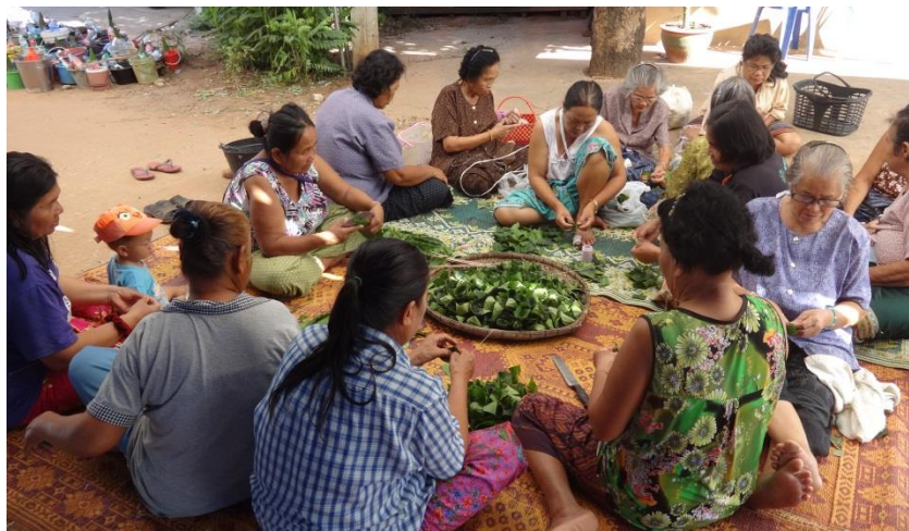
ภาพ 44 แสดงชาวบ้านผู้หญิงช่วยกันจัดเตรียมจอกส้ม จอกหวาน แกงส้ม แกงหวาน

1.3 การจัดเตรียมจอกส้มจอกหวาน แกงส้ม แกงหวาน สำหรับใส่ลงในกระทง ซึ่งจะต้องใช้เป็นจำนวนมาก ดังนั้นชาวบ้านที่เป็นผู้หญิงจะช่วยกันจัดเตรียมไว้สำหรับใช้ในพิธี