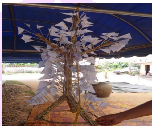
ภาพ 20 แสดงต้นเสดกะลัด (เศวตฉัตร)

4.6 ต้นเสดกะลัด หรือต้นเศวตฉัตร มีลักษณะคล้ายกับต้นเงินผ้าป่า ความสูงประมาณ 1 เมตร ส่วนลำต้นทำจากหญ้าคามัดรวมกันเป็นมัดส่วนล่างมัดเป็น 3 ส่วน เพื่อทำขาตั้ง ส่วนบนมัดเป็น 3 ส่วนแต่เหลือส่วนกลางไว้เพื่อทำเป็นยอด ประดับด้วยช่อน้อยจำนวน 100 ช่อขึ้นไป ซึ่งช่อนั้นทำจากกระดาษสีขาวตัดเป็นรูปสามเหลี่ยมปักลงไปทีลำต้น สำหรับนำไปห้อยบริเวณใกล้กับฝ้ายชะตาบ้าน