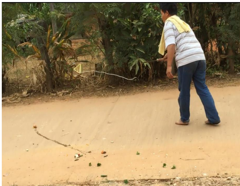
ภาพ 71 แสดงการโยนกระถงหน้าวัชพืชนอกเรือน

2.8 ขั้นตอนการสวดบทเห็ดเวียกเฮียน เป็นขั้นตอนที่ทำหลังจากที่ประกอบพิธี สวดธอดสูตรถอนเรียบริบร้อยแล้ว หลังจากให้อาจารย์ธรรมกลับมาตั้งประจำที่แล้วจากนั้นจับ ด้ายสายสิญจน์หันหาเข้าหาผู้รับการเห็ดเวียก ซึ่งนั่งประนมมืออยู่ภายในเขตบริเวณที่ด้าย สายสิญจน์ล้อม จากนั้นเริ่มสวดบทเห็ดเวียกเฮียนดังนี้