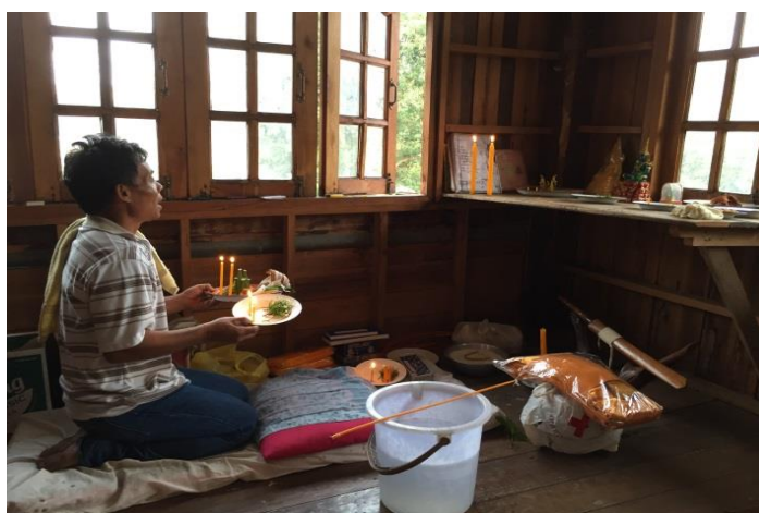
ภาพ 65 แสดงอาจารย์ธรรมบอกกล่าวต่อสิ่งที่เคารพนับถือ

มารดาครูบาอาจารย์ว่าวันนี้จะทำการเห็ดเวียงเหียนเพื่อความอยู่สุขสวัสดิ์ของผู้ที่อาศัยอยู่ในเรือนหลังนี้ พอบอกกล่าวเสร็จแล้วนำชั้นค้ายวางไว้บริเวณหน้าห้องพระแล้วกราบลงอีกสามครั้ง จากนั้นก็จะเป็นขั้นตอนการปาวเทวดาเป็นขั้นตอนต่อไป