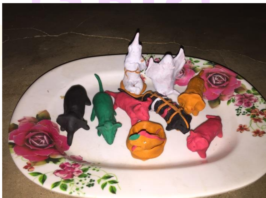
ภาพ 32 แสดงรูปปั้นเทวดา และสัตว์ประเภทต่าง ๆ

สารมะโน, ผู้ให้สัมภาษณ์, 6 มิถุนายน 2560)