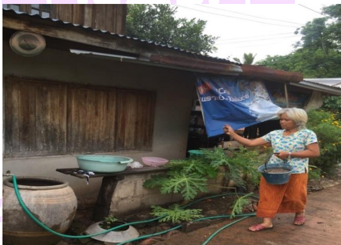
ภาพ 54 แสดงการหว่านทรายและแห่ (กรวด) รอบเรือนที่อยู่อาศัยของตนเอง