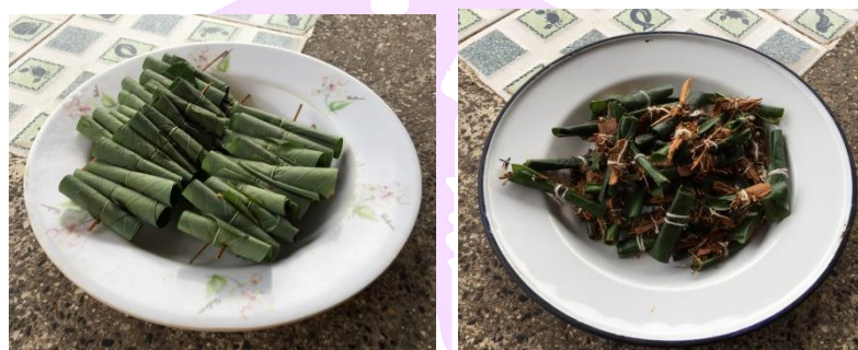
ภาพ 26 แสดงห่อเมียงและคำหมาก

4.9.5 คำหมาก ได้จากใบพลูป้ายด้วยปูนขาวพ่นให้เป็นม้วน นำผลหมากแห้ง สีสเลียด เปลือกหาคัด และยาเส้นมัดรวมกันด้วยเส้นฝ้าย เรียกว่า “คำหมาก” ใส่ลงในกระทงห้องละ 8 คำ