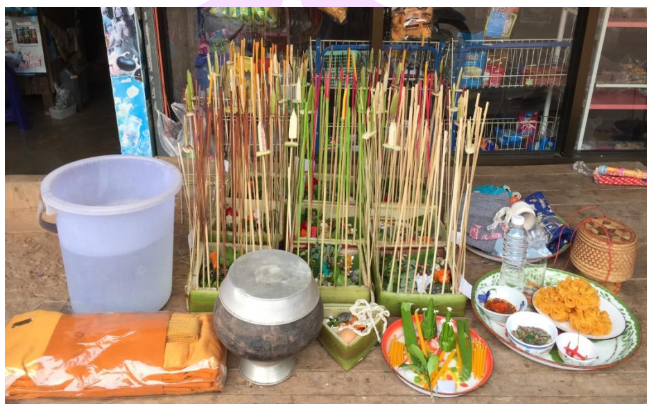
ภาพ 62 แสดงเครื่องประกอบพิธีกรรมเฮ็ดเวียกเฮียน

4.12. เทียนเวียนหัว เป็นเทียนที่มีความยาวเท่ากับรอบศีรษะ สำหรับให้อาจารย์ธรรมทำน้ำมนต์ 1 เล่ม และนำไปจุดภายในบริเวณเขตของกระทงนพเคราะห์อีก 1 เล่ม