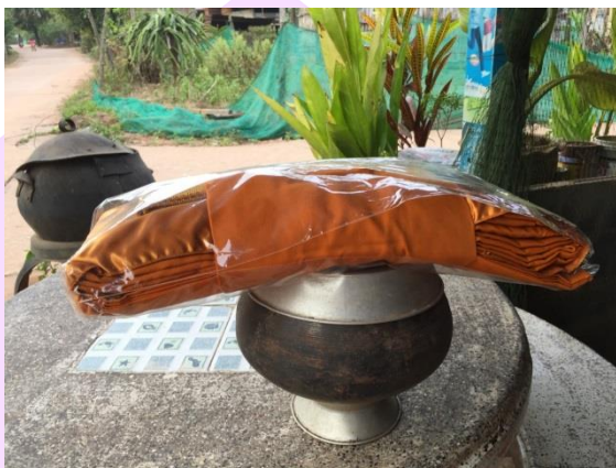
ภาพ 58 แสดงเครื่องอัฐบริหาร

4.4 เครื่องอัฐบริหาร คือเครื่องใช้สอยของพระภิกษุในพระพุทธศาสนา มี 8 อย่าง คือ สบง จีวร สังฆาฏิ บาตร มีดโกน เข็ม ประคดเอาจว กระจบอกรองน้ำ เนื่องจากพิธีกรรม เสด็จเรียกเขียนจะไม่ใช้พระสงฆ์ในการประกอบพิธีกรรมแต่ด้วยความเคารพในพระสงฆ์ จึงได้ใช้ เครื่องอัฐบริหารนี้เป็นสัญลักษณ์แทน (แก้ว วังศิริ, ผู้ให้สัมภาษณ์, 8 ธันวาคม 2560)