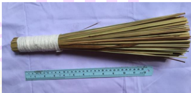
ภาพ 15 แสดงไม้พรมน้มนต์

4.1.8 ไม้พรมน้มนต์ ทำจากลำต้นของหญ้าคาแห้งตัดให้มีความยาวประมาณ 30 - 40 เซนติเมตร นำมามัดรวมกันประมาณ 1 กำมือ ใช้สำหรับให้พระสงฆ์ ประพรมน้ำพระพุทธมนต์ (มี จันทะวงศ์, ผู้ให้สัมภาษณ์, 4 มิถุนายน 2560)