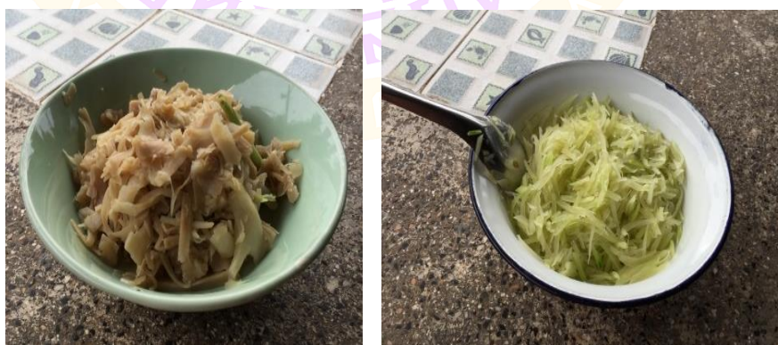
ภาพ 25 แสดงแกงส้มแกงหวาน

4.9.3 แกงหวาน ทำจากมะละกอหรือแกงผักใส่น้ำตาลใส่ลงในกระทงห้องละ 8 จอก