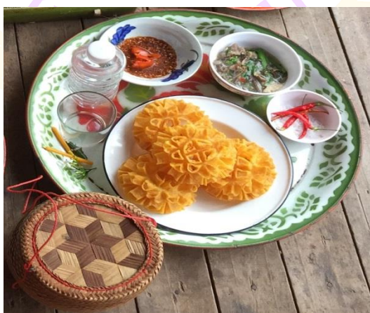
ภาพ 59 แสดงพาเข้า

4.6 พาเข้า หมายถึง สำหรับอาหาร ซึ่งเป็นอาหารที่ชาวบ้านรับประทานทั่วไป แต่ สิ่งที่ขาดไม่ได้ในสำหรับอาหารคือ พริก เกลือ และนํ้า รวมถึงใส่เทียนเล่มเล็กในถาดสำหรับด้วย 1 คู่ ดอกไม้สีขาวอีก 1 คู่ และคําหมากพลู 1 คํา