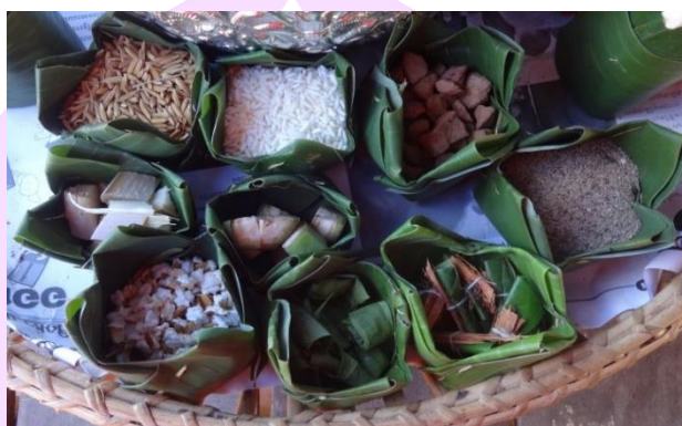
ภาพ 10 แสดงกระทงจอกแก้ว

4.1.3 กระทงจอกแก้ว คือถ้วยสำหรับใส่สิ่งของเก่าอย่างทำจากใบตอง ลักษณะคล้ายกระทงแต่มีขนาดเล็ก รูปทรงกลมมีเส้นผ่านศูนย์กลางประมาณ 4-5 เซนติเมตร จำนวน 9 จอก ประกอบไปด้วย จอกข้าวเปลือก จอกข้าวสาร จอกทราย จอกแษฐ์ (กรวด) จอกข้าวตอกแตก (ข้าวเปลือกคั่ว) จอกกล้วย (ใส่กล้วยดิบจำนวน 9 ชิ้น) จอกอ้อย (ใส่อ้อยจำนวน 9 ชิ้น) จอกคำเมียง (ใส่เมียงจำนวน 9 คำ) จอกคำหมาก (ใส่หมากจำนวน 9 คำ)