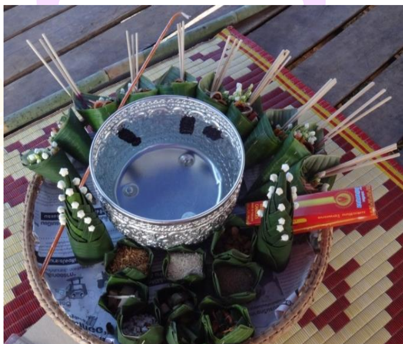
ภาพ 7 แสดงพาบัญคุณ (พานมงคล) ที่จัดไว้สำหรับบูชาพระรัตนตรัย

4.1 พาบัญคุณ (พานมงคล) หมายถึง พานสิ่งของต่าง ๆ ที่จัดไว้สำหรับบูชาคุณพระรัตนตรัย และเป็นเครื่องประกอบในการเจริญพระพุทธมนต์เพื่อทำน้ामนต์ สิ่งของต่าง ๆ จะถูกนำมาจัดเรียงใส่ในพานข้าวหย่องคือถาดที่ทำจากหวายหรือไม้มีฐานยกสูงจากพื้นประมาณ 20-30 เซนติเมตร ใช้ในกรณีที่มีการนิมนต์พระสงฆ์มาเจริญพระพุทธมนต์ในงานมงคลต่าง ๆ โดยเฉพาะในพิธีกรรมเฮ็ดเวียกหมู่บ้านจะขาดไม่ได้ พาบัญคุณประกอบด้วย