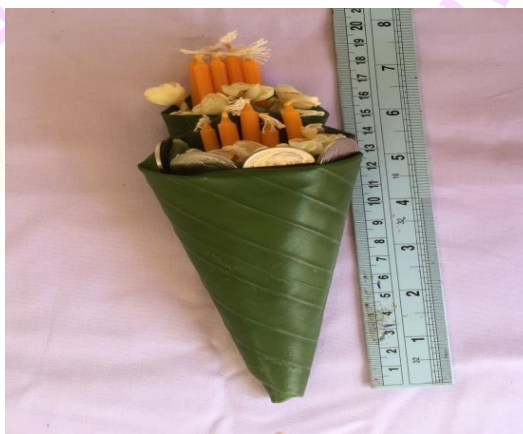
ภาพ 9 แสดงโขยบูชา (กรวยบูชา)

4.1.2 โขยคาย หมายถึง กรวยที่ทำจากใบตองสำหรับใส่เงินค่าครูจำนวน 1 กรวย ลักษณะเหมือนกับโขยบูชา (กรวยบูชา) ข้างในกรวยประกอบด้วย เทียนเล่มเล็ก 5 เล่ม ดอกไม้สีขาว 5 ดอก รวมเรียกว่าชั้นห้า และเทียนเล่มเล็ก 8 เล่ม ดอกไม้สีขาว 8 ดอก รวมเรียกว่า ชั้นแปด เงินจำนวน 4 บาท ทั้งหมดถูกจัดลงในโขยหรือกรวย รวมแล้วเรียกว่า “โขยคาย”