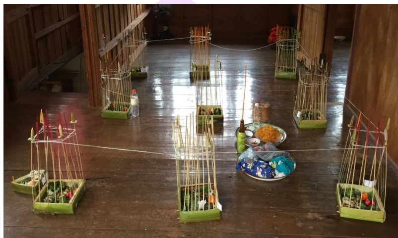
ภาพ 64 แสดงการจัดวางเครื่องประกอบพิธีกรรมเฮ็ดเวียกเฮียน

ทางเจ้าของเรือนทราบและหามาให้ครบตามที่กำหนด เมื่อเครื่องประกอบพิธีกรรมครบทุกอย่างแล้ว อาจารย์ธรรมพร้อมทั้งเจ้าของเรือนก็จะนำเครื่องประกอบพิธีขึ้นไปจัดวางบนเรือนหน้าห้องพระ หรือส่วนใดของบ้านก็ได้แต่ต้องดูให้เหมาะกับการประกอบพิธี (อำนาจ วงศ์ศิริ, ผู้ให้สัมภาษณ์, 8 ธันวาคม 2560)