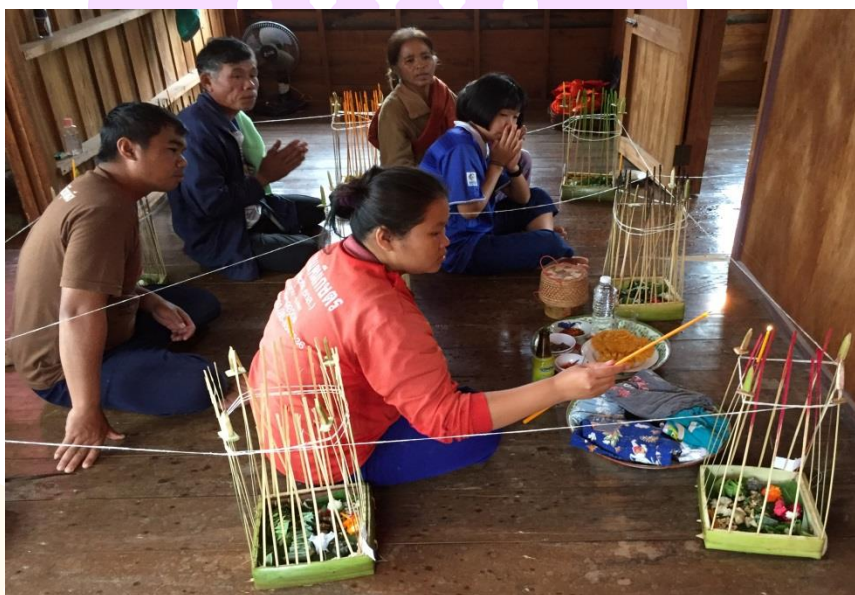
ภาพ 72 แสดงผู้รับการเฮ็ดเวียกจุดธูปเทียนที่อยู่ภายในกระทงพระอาทิตย์

หลังจากที่อาจารย์ธรรมกล่าวยอวยพรเสร็จแล้ว ผู้รับการเฮ็ดเวียกทุกคนเปล่งคำว่า “สาธุ” พร้อมกัน จากนั้นจะเป็นการสวดส่งกระทงเทวดานพเคราะห์ไปที่ละกระทง เริ่มต้นที่ กระทงพระอาทิตย์ก่อน โดยผู้รับการเฮ็ดเวียกที่อยู่ภายในบริเวณนั้นจุดธูปเทียนที่อยู่ภายใน กระทง