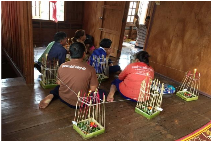
ภาพ 74 แสดงอาจารย์ธรรมประพรมนำมนต์ให้แก่ผู้รับการเฮ็ดเวียกเฮียน

2.10 ชั้นผูกแขน เป็นขั้นตอนที่อาจารย์ธรรมนำฝ่ายผูกแขนที่ปลุกเสกในพิธีกรรมเฮ็ดเวียกเฮียนแล้ว นำมาผูกแขนให้แก่ผู้รับการเฮ็ดเวียกเฮียนทุกคนในครอบครัว เพื่อความเป็นสิริมงคลและป้องกันเคราะห์ หรือสิ่งชั่วร้ายทั้งหลายไม่ให้นำมาบงกช ในขณะผูกข้อแขนนั้น อาจารย์ธรรมจะท่องบทผูกแขนไปด้วย ดังนี้