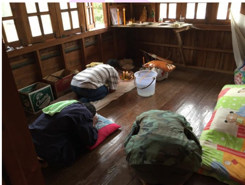
ภาพ 67 แสดงการยอขันดอกไม้หรือบูชาดอกไม้

พอกกล่าวคำบูชาดอกไม้เสร็จแล้ว อาจารย์ธรรมกราบลงสามครั้งจากนั้นก็กล่าว คำอาราธนาธรรมเป็นขั้นตอนต่อไป