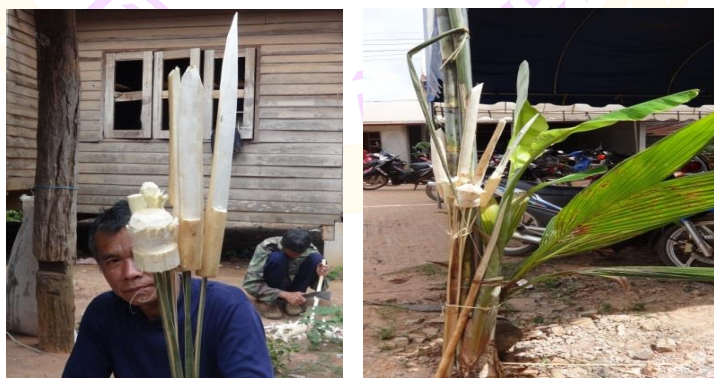
ภาพ 21 แสดงเครื่องประกอบสี่ทิศ

4.7 เครื่องประกอบสี่ทิศ สำหรับมัดไว้กับเสาของเต็นท์ปะรำพิธีทั้ง 4 ทิศ โดยเครื่องประกอบพิธีแต่ละชุดประกอบด้วย ต้นกล้วย ต้นอ้อย หน่อมะพร้าว หน่อหมาก ดอกบัวหลวงบาน ดอกบัวน้อยบาน ดอกบัวน้อยตูม ตลอดจนทั้งปิ่น ดาบ และหอก ซึ่งทำจากไม้เนื้ออ่อน เช่น ไม้จ้าว ไม้สา ฯลฯ