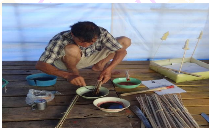
ภาพ 43 แสดงการย้อมสีช่อและสีธง

1.2 การย้อมสีช่อและสีธง ซึ่งประกอบไปด้วยสีดำ แดง เหลือง ขาว เขียว เพื่อเตรียมไว้สำหรับปักกรอบกระทงแต่ละประเภทซึ่งจะต้องใช้เป็นจำนวนมาก การย้อมสีช่อและธงนั้นใครจะทำก็ได้ไม่มีการกำหนดตัวบุคคล