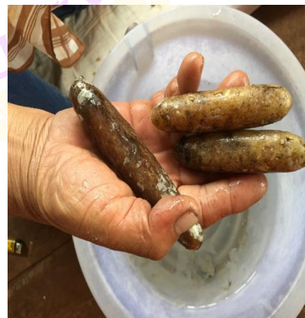
ภาพ 68 แสดงการทำน้ำมนต์