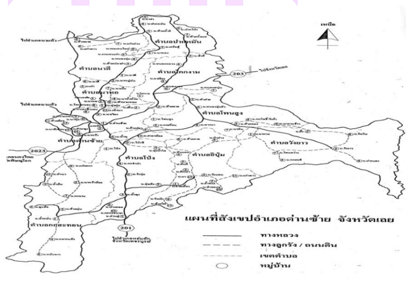
ภาพ 5 แสดงแผนที่ของอำเภอด่านซ้าย จังหวัดเลย

ทิศตะวันตก ติดอำเภอนครไทย จังหวัดพิษณุโลก และอำเภอนาแห้ว จังหวัดเลย