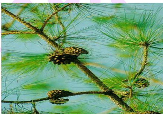
ภาพ 3 แสดงต้นสนสามใบต้นไม้ประจำจังหวัดเลย