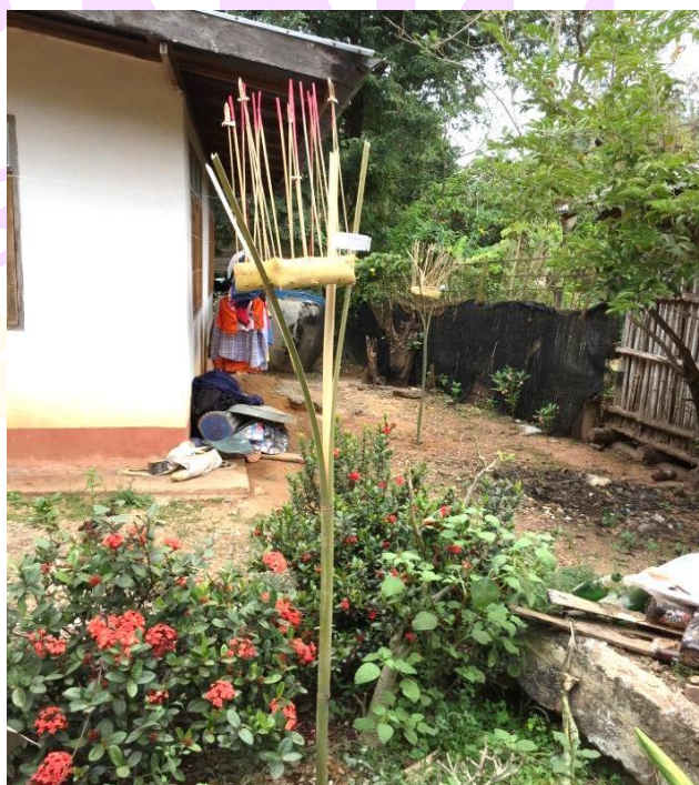
ภาพ 76 แสดงกระทงเทวดานพเคราะห์ที่อยู่บนหลักไม้

ในการประกอบพิธีกรรมเฮ็ดเวียกเฮียนนั้นมีข้อห้ามว่า หลังจากประกอบพิธีกรรมเสร็จแล้วในช่วงระยะเวลา 3 วัน ห้ามนำสิ่งของที่อยู่ในเรือนให้ใครยืม หรือห้ามนำสิ่งของทุกอย่างออกนอกเรือนเป็นอันขาด แต่ถ้าบางสิ่งจำเป็นที่ต้องใช้ เช่น เงิน รถ เป็นต้นให้นำไปฝากไว้กับญาติพี่น้องก่อนที่จะประกอบพิธี มิฉะนั้นการประกอบพิธีกรรมถือว่าไม่สำเร็จ หรือที่ชาวบ้านหนองหลวงเรียกว่า “เฮ็ดเวียกบดก” อันเป็นความเชื่อที่สืบทอดมาแต่โบราณ (อุดม สารมะโน, ผู้ให้สัมภาษณ์, 9 ธันวาคม 2560)