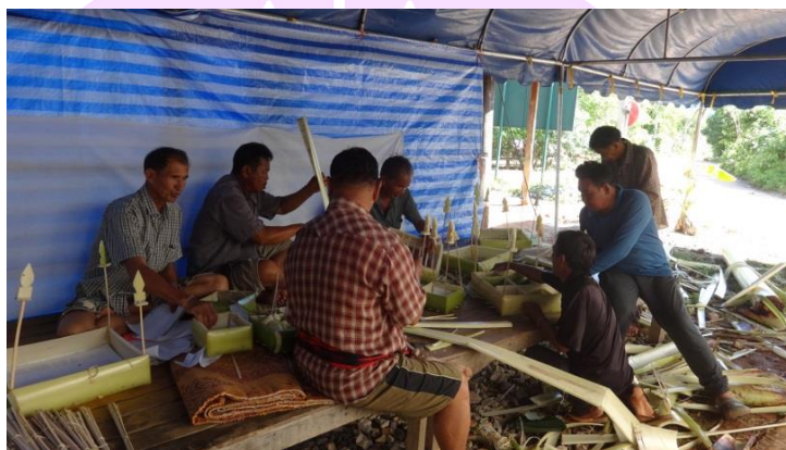
ภาพ 42 แสดงชาวบ้านผู้ที่ได้รับมอบหมายหน้าที่กำลังช่วยกันทำกระทงแต่ละประเภท

1.1 การเตรียมกระทงสำหรับสะเดาะเคราะห์และส่งเคราะห์ เพื่อใช้สำหรับประกอบพิธีในตอนเช้าของวันที่สาม ซึ่งส่วนนี้ผู้ที่ได้รับมอบหมายหน้าที่จะมาช่วยกันทำกระทง ซึ่งมีทั้งหมด 3 ประเภทคือ กระทงแก้ห้อย 1 กระทง กระทงเวียงใน 4 กระทง กระทงเวียงนอก 8 กระทง รวมทั้งหมด 13 กระทง รายละเอียดของกระทงแต่ละประเภทผู้วิจัยได้กล่าวไว้แล้วในเบื้องต้น