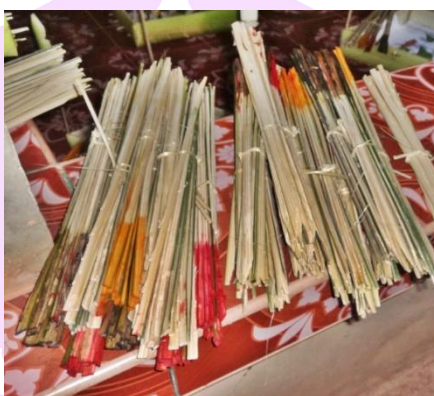
ภาพ 30 แสดงช่อ ชุง (ธง)

4.9.9 ช่อ ชุง (ธง) ทำด้วยไม้ไผ่ผ่าเป็นซี่ความยาวประมาณ 40 เซนติเมตร ความหนาบางประมาณ 2-3 มิลลิเมตร แต่ละหลักทำให้เป็นรอยบาก 3 รอย แต่ละรอยมี 3 บาก ถ้าบากขึ้นเรียกว่า ชุงหรือธง ถ้าบากลงเรียกว่า ช่อ ทั้งสองอย่างมีความต่างกันดังกล่าว ทั้งหมดจะย้อมสี ดำ แดง เหลือง เช่นเดียวกันกับการย้อมข้าวเหนียว ส่วนสีขาวคือสีของไม้ไม้ไม่ต้องย้อม เสร็จแล้วปักช่อและชุงทุกสีลงบนขอบของกระทงทุกห้อง ห้องละ 8 หลัก