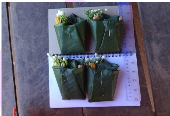
ภาพ 16 แสดงไชยหมากแจก หรือบั้งแจก สำหรับใส่ในถาดภัตตาหาร

ส่วนบุญส่วนกุศลให้แก่ท่านเหล่านี้ เหมือนกับการแจกจ่ายสิ่งของ จึงเรียกว่า “แจก” ซึ่งในไชย หมากแจกทั้งสิ้นแต่ละกรวยประกอบไปด้วยเทียนเล่มเล็ก 5 เล่ม ดอกไม้สีขาว 5 ดอก ยาสูบ (บุหรี) 1 มวน เมียง 1 คำห่อหมากและยาเส้น 1 ห่อ ซึ่งห่อด้วยใบตองลักษณะคล้ายกับการห่อ เมียงคำ (คำ วังคีรี, ผู้ให้สัมภาษณ์, 4 มิถุนายน 2560)