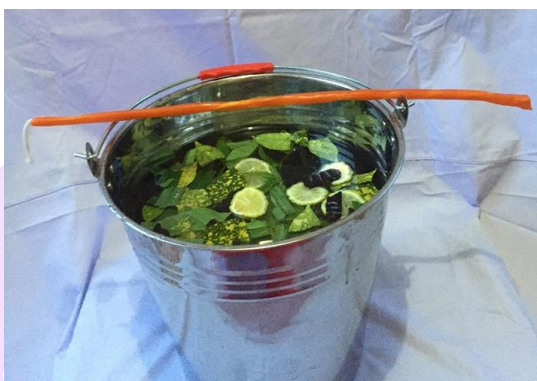
ภาพ 37 แสดงคุน้ำมนต์

4.13 คุน้ำมนต์ คือธงสำหรับใส่น้ำเพื่อทำน้ำมนต์ ซึ่งในถงนั้นจะใส่ผลมะกรูด ใบว่านชน (ใบพลับพลึง) ใบและดอกว่านธรณีสาร ผลส้มป่อย ใบโกศล ใบหมากเขียบ (ใบน้อยหน้า) ตามที่จะหาได้ นำมาใส่ลงไปในถงน้ำนั้น และเทียนเวียนหัวอีก 1 เล่ม