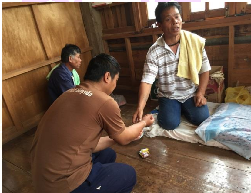
ภาพ 75 แสดงอาจารย์ธรรมผูกแขนให้แก่ผู้รับการเห็ดเวียกเขียน

หลังจากที่อาจารย์ธรรมผูกแขนให้ผู้รับการเห็ดเวียกทุกคนในเรือนนั้นเสร็จแล้วทุกคนก็จะหันหน้าไปทางหิ้งพระแล้วกราบพระรัตนตรัยพร้อมกัน จากนั้นอาจารย์ธรรมจะเก็บสิ่งของประจำตัวของท่านซึ่งได้แก่ เทียนนครู มีดดาบ เครื่องอัฐบริขาร และตำราบทสวดเพื่อนำกลับไปไว้ที่บ้านของอาจารย์ธรรมตามเดิม และเมื่อทุกอย่างเรียบร้อยแล้วขั้นสุดท้ายของพิธีกรรมเห็ดเวียกเขียนก็คือขั้นการล้อมเรือนด้วยกระทงและด้ายสายสิญจน์