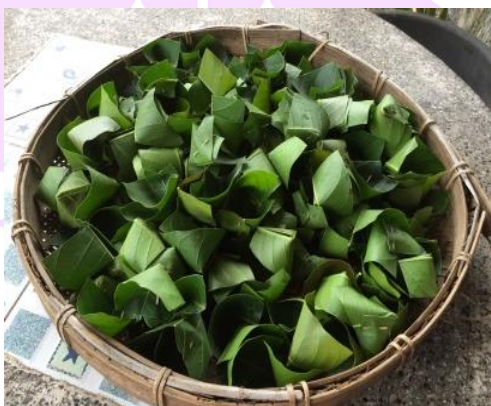
ภาพ 24 แสดงจอกส้มจอกหวาน

4.9.1 จอกส้มจอกหวาน คือกรวยเล็ก ๆ ที่ทำจากใบมะม่วงหรือใบขนุนเป็นภาชนะสำหรับใส่แกงส้มแกงหวานลงในกระทงแต่ละห้องจำนวนห้องละ 8 รวมทั้งหมด 144 อัน