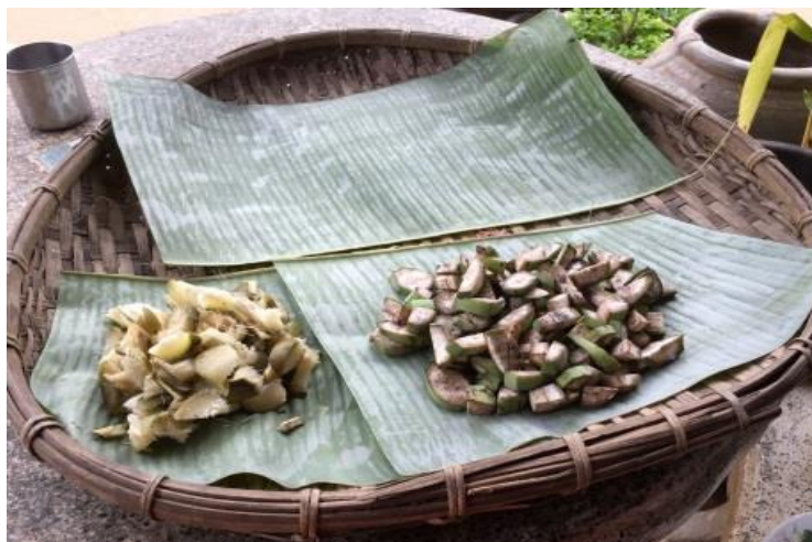
ภาพ 28 แสดงกั้วยดิบและอ้อยที่หั่นแล้ว

4.9.7 กั้วยดิบ อ้อย หั่นเป็นชิ้นเล็ก ๆ ขนาดเท่าหัวแม่มือใส่ลงในกระทงห้อง ละ 8 ชิ้น