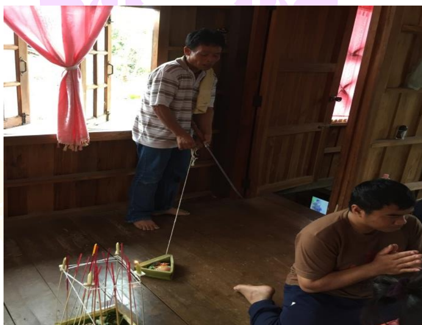
ภาพ 70 แสดงการสูตรถอดสูตรถอน

อิมัง กังสัง ยา ถอดถอนครูบาอาจารย์ วา สะ กัง ยา ถอด ยา ถอนถอนครูบา อาจารย์ ยะทะยะถอน เยโต สาระกัง ถอด เยตะกังถอด ถอนถอนออกมาถอดมาครูบาอาจารย์ วาเสวะกังถอด ยะกังถอน ยะกังถอน ถอดถอนถอนออกมาครูบาอาจารย์ วาเส ครูบาอาจารย์ เต โลกัง ยะทะยะถอนเคราะห์เข็ญออกมาครูบาอาจารย์ ชักเคราะห์ชักเข็ญออกไปครูบา อาจารย์เคราะห์เข็ญสิ่งฮ้าย ๆ ทั้งหลายถอด จีวังถอนถอนออกมาครูบาอาจารย์ วา โลกัง สาระกัง วา โส ครูบาอาจารย์ เตวา เต โส ครูบาอาจารย์ เต โย เต ถอด เต โย เต ถอนถอน ออกมาครูบาอาจารย์ ยโส ไร ไร ถอด ยโส ไร ไร ถอนครูบาอาจารย์ ตั้งเต ตั้งถอด ตั้งเต ตั้ง ถอนถอนออกมาครูบาอาจารย์ วาโสเก โสกัง ถอนถอนออกมาครูบาอาจารย์ อิมังกัง ยัตตะ ยัตถอน ดอนออกมาครูบาอาจารย์ วาสัง ละกัง ยะสังละกังถอดถอนถอนออกมาครูบาอาจารย์ เต โย ถอด เต โยถอนถอนออกมาครูบาอาจารย์ ยะกัง อิมัง กัง เส เสนียดัจญ์ไรออกจากเรือน ชานทั้งหมดครูบาอาจารย์ ยะ มัง กังโส เตวา โส โลเก โลกัง สาระกัง วา ถอด