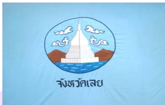
ภาพ 2 แสดงธงประจำจังหวัดเลย

ที่มา: สำนักงานจังหวัดเลย ศาลากลางจังหวัดเลย, 2560, หน้า 1