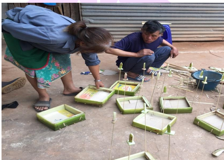
ภาพ 63 แสดงผู้รับการเฮ็ดเวียกเฮียกเฮียนกำลังทำกระทงประเภทต่าง ๆ

1.2 การเตรียมกระทงประเภทต่าง ๆ ซึ่งประกอบด้วยกระทงทั้งหมด 10 กระทง ได้แก่ กระทงหน้าวัว กระทงพระอาทิตย์ พระจันทร์ พระอังคาร พระพุธ พระพฤหัสบดี พระศุกร์ พระเสาร์ พระราหู และพระลัคนา (พระเกตุ) ในการเตรียมกระทงในพิธีกรรมเฮ็ดเวียกเฮียกเฮียนต้องเตรียมไว้ก่อนวันประกอบพิธีกรรมล่วงหน้า 1 วัน โดยผู้รับการเฮ็ดเวียกเป็นผู้จัดเตรียมเองหรือมอบหมายให้ผู้อื่นซึ่งเป็นผู้รู้เป็นผู้จัดเตรียมให้ก็ได้ (สุทธิ วันทองสุข, ผู้ให้สัมภาษณ์, 8 ธันวาคม 2560)