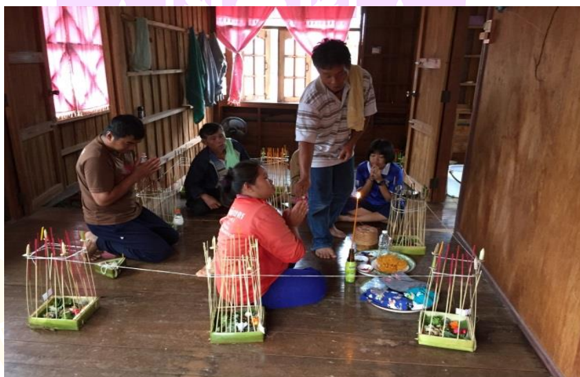
ภาพ 69 แสดงการจ้ำคิง

พอสวดจบแล้วโยนคำข้าวทิ้งลงในกระทงเทวดานพเคราะห์ตามวันเกิดของแต่ละคน