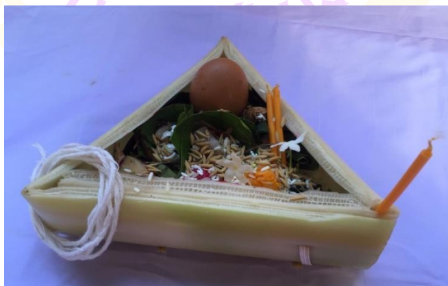
ภาพ 55 แสดงกระทงหน้าวัว

4.1 กระทงหน้าวัว เป็นกระทงสำหรับใช้ในพิธีกรรมการสวดถอนสิ่งที่ไม่ดีที่เชื่อว่าเป็น เสนียดจัญไรออกจากเรือนที่อยู่อาศัย ลักษณะของกระทงเป็นรูปทรงสามเหลี่ยมคล้ายกับ ลักษณะหน้าของวัวจึงเรียกว่ากระทงหน้าวัว ทำจากกาบกล้วยพับเป็นสามเหลี่ยม แต่ละด้าน ยาวด้านละประมาณ 1 คืบ ภายในกระทงหน้าวัวประกอบด้วย คำเมียง คำหมากพลูอย่างละ 4 คำ กล้วยหั่นเป็นชิ้นเล็ก ๆ อ้อยตัดเป็นชิ้นเล็ก ๆ อย่างละ 4 ชิ้น แกงส้ม แกงหวานจัดใส่ใน จอกส้มจอกหวานใส่จำนวนอย่างละ 4 จอก ข้าวดำ ข้าวแดง ข้าวเหลือง ข้าวขาวอย่างละ 1 ก้อน ข้าวดอกแตก ข้าวเปลือก ข้าวสารไม่จำกัดจำนวน ดอกไม้สีขาว 1 คู่ เทียนเล่มเล็ก 1 คู่ เทียนเล่มเล็กสำหรับจุดทำพิธี 1 เล่ม ไข่ดิบ 1 ลูก และฝ้ายซัก 1 เส้น คือธำมรงค์มัดลาก กระทงหน้าวัวโดยการใช้ธำมรงค์มัดเป็นเจ็ดเส้นความยาวประมาณ 1 วา (บุญเรือน วังศิริ, ผู้ให้ สัมภาษณ์, 8 ธันวาคม 2560)