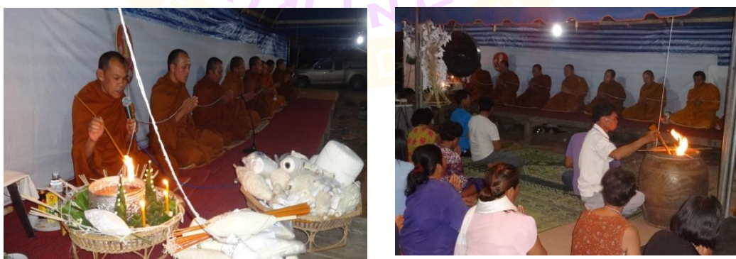
ภาพ 41 แสดงขณะที่ประธานสงฆ์และมัคคานายกประกอบพิธีกรรมทำน้ำมนต์

2.3 ขั้นตอนการทำน้ำมนต์ ในขณะที่ประกอบพิธีกรรมเมื่อพระสงฆ์เจริญพระพุทธมนต์ถึงบทมงคลสูตร บทคาถาว่า อเสวนา จะ พาลานัง... ผู้ใหญ่อำเภอจตุรพิธวันน้ำมนต์ที่อยู่ในพาศุภคุณแล้วจับยกประเคนแต่ประธานสงฆ์เพื่อให้ท่านหยดเทียนลงในขันน้ำมนต์พร้อมกันนั้นมัคคานายกนำเทียนเวียนหัว (เทียนยาว) มามัดบิตรวมกันและนำด้ายสายสิญจน์ที่โยงมาจากพระพุทธรูปมาเวียนรอบเทียน 3 รอบแล้วจุดเทียนให้หยดลงในตุ่มน้ำกลางเต็นท์ปะรำพิธี