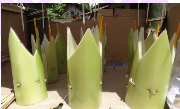
ภาพ 22 แสดงจอกแก้ว

4.8. ฮ้านจอกแก้ว (แทนบูชา) ทำขึ้นเพื่อเป็นสถานที่บูชาเทวดาที่ได้อััญเชิญมาจากทิศต่าง ๆ เพื่อมาร่วมฟังพระสงฆ์เจริญพระพุทธมนต์ เป็นแทนบูชาที่มีลักษณะเป็นเสา 4 เสา ทำจากไม้ไผ่ มีพื้นด้านบน มีฝารอบ 3 ด้าน คือด้านซ้าย ด้านขวา และด้านหลัง โดยเหลือด้านหน้าไว้ มุงหลังคาด้วยหญ้าคาหรือวัสดุอื่น ๆ ที่ใช้แทนกันได้ มีความสูงจากพื้นดินถึงหลังคาประมาณ 2 เมตร ความกว้างด้านละ 1 เมตร ภายในประกอบด้วยเครื่องบูชาคือ ดอกไม้ ขาวจำนวน 1 คู่ จอกแก้วที่ทำจากกาบกล้วยจำนวน 9 จอก โดยวิธีการทำจอกแก้วดังกล่าวมีวิธีการทำคือตัดกาบกล้วยให้ยาวประมาณ 25 เซนติเมตร จากนั้นเนียนด้านใดด้านหนึ่งทำปลายให้แหลมเป็นสามเหลี่ยม ทำจนครบ 3 อัน เสร็จแล้วนำมาประกบกันเสียบด้วยไม้ดอก จะได้จอกแก้วทรงกระบอก ทำจนครบจำนวน 9 อัน เสร็จแล้วนำเทียนเล่มเล็ก และธูป ปักลงไปที่ยอดปากของจอกแก้ว อย่างละ 1 จนครบ 9 อัน (อำนวยการ วังคีรี, ผู้ให้สัมภาษณ์, 4 มิถุนายน 2560)