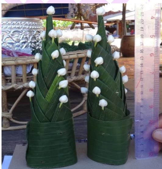
ภาพ 11 แสดงต้นหมากเบ็ง หรือต้นหมากเบญจ

4.1.4 ต้นหมากเบ็ง หรือต้นหมากเบญจ จำนวน 2 ต้น ทำจากใบตองมี 5 ชั้น ลักษณะเป็นรูปกรวยคว่ำหลาย ๆ อัน ตรึงให้เป็นชุดเดียวกันกมัดด้วยไม้กมัด ที่ส่วนปลาย ประดับด้วยดอกไม้สีขาวเล็ก ๆ คล้ายกับพานพุ่ม สูงประมาณ 15-20 เซนติเมตร