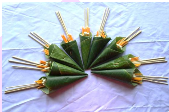
ภาพ 8 แสดงโขยบูชา (กรวยบูชา)

4.1.1 โขยบูชา (กรวยบูชา) คือกรวยที่ทำจากใบตองสำหรับบูชาพระรัตนตรัย จำนวน 9 กรวย ในแต่ละกรวยประกอบไปด้วย ดอกไม้สีขาว 5 ดอก เทียนเล่มเล็ก 5 เล่ม ก้อย อ้อย อย่างละ 1 ชิ้น ห้อยยาเส้น (ยาเส้นที่ห่อด้วยใบตองลักษณะคล้ายกับการห่อเมี่ยงคำ) 1 ห่อ เมี่ยง (ทำจากขิงหรือตะไคร้ห่อด้วยใบมันสำปะหลัง) 1 คำ หมาก 3 ชิ้น และรูป 3 ดอก