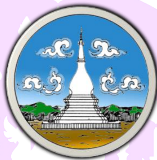
ภาพ 1 แสดงดวงตราสัญลักษณ์ของจังหวัดเลย

ที่มา: สำนักงานจังหวัดเลย ศาลากลางจังหวัดเลย, 2560, หน้า 1