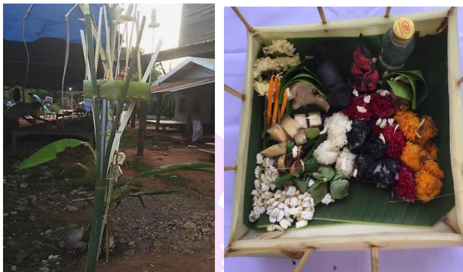
ภาพ 34 แสดงกระทงเวียงในทิศทักษิณ (ใต้)

4.11 กระทงเวียงนอก คือกระทงสะเดาะเคราะห์หรือกระทงส่งเคราะห์ จะนำไปทิ้งนอกหมู่บ้านตามทิศต่าง ๆ หลังจากที่ประกอบพิธีกรรมเสร็จ มีวิธีการทำเหมือนกับกระทงเวียงใน แต่มีขนาดใหญ่กว่าคือ มีความกว้างยาวด้านละประมาณ 40 เซนติเมตร มีจำนวน 8 กระทงประกอบด้วย