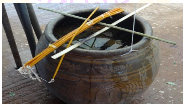
ภาพ 17 แสดงตุ่มใส่น้ำเพื่อทำน้ำมนต์ และไม้ไขว้ตีนกา (ไม้มงคล)

4.3 ตุ่มใส่น้ำเพื่อทำน้ำมนต์ จัดวางไว้ในตรงกลางเต็นท์ปะรำพิธี โยงด้ายสายสิญจน์ จากพระพุทธรูปมาวนรอบตุ่ม 1 รอบ นำไม้ไขว้ตีนกา (ไม้มงคล) และเทียนเวียนหัววางไขว้บนปาก ตุ่ม ภายในตุ่มใส่ จอก แหน หญ้าไซ ส้มป่อย (ถนอม จันทะวงศ์, ผู้ให้สัมภาษณ์, 4 มิถุนายน 2560)