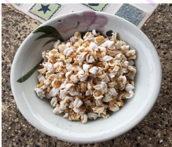
ภาพ 31 แสดงข้าวตอก หรือข้าวตอกแตก

4.9.10 ข้าวตอก หรือที่ชาวบ้านเรียกว่า “ข้าวตอกแตก” ได้จากการเอาข้าวเปลือกที่เป็นข้าวเหนียวมาคั่วให้ร้อนจนกว่าจะแตกออกจากเปลือก โปรยลงในกระทงในแต่ละห้องทั้ง 9 ไม่มีการกำหนดจำนวนใส่โปรยในปริมาณพอสมควร