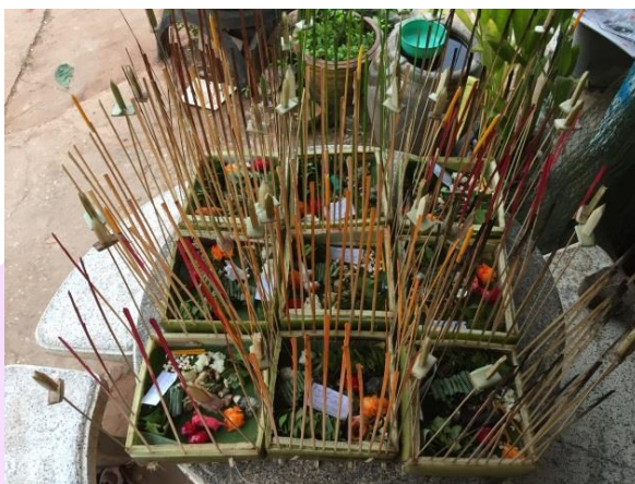
ภาพ 56 แสดงกระทงเทวดานพเคราะห์

คู่ เทียนเล่มเล็กสำหรับจุดทำพิธี 1 เล่ม รูป 1 ดอก และรูปปั้นเทวดานั่งแท่น 1 องค์ (สุกี้ วังศิริ, ผู้ให้สัมภาษณ์, 8 ธันวาคม 2560)