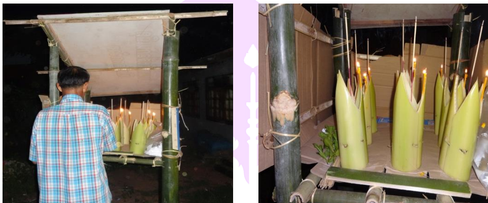
ภาพ 40 แสดงผู้ใหญ่อำเภอหนองหลวงจตุรพิธวันบูชาเทวดาที่ฮ้านจอกแก้ว

มงคลสูตร รัตนสูตร กรณียเมตตสูตร ชั้นอธิปริตร วัฏฏกปริตร พุทธคุณ ธรรมคุณ สังฆคุณ โอสถปริตร โพชฌังคปริตร อภยปริตร คาถาโพธิบาท คาถาหว่านทราย ชยปริตร เทวดาอุยโยชนคาถา และสัพพมงคลคาถา ตามลำดับ หลังจากที่ได้รับพระสงฆ์เจริญพระพุทธมนต์จบแล้ว มัคคานายกตีฆ้อง 3 ครั้ง เพื่อความเป็นสิริมงคล และตามความเชื่อเป็นการส่งเทวดาให้กลับที่อยู่ของตน