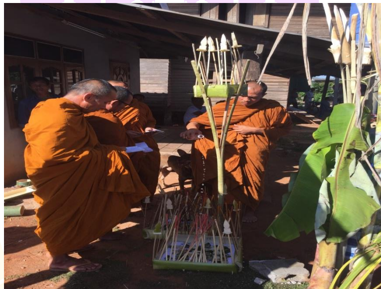
ภาพ 51 แสดงพระสงฆ์สวดส่งกระทงสะเดาะเคราะห์

2.9 ขั้นตอนการสวดส่งกระทง เป็นขั้นตอนที่กระทำหลังจากพระสงฆ์ฉันภัตตาหารเสร็จและชาวบ้านรับประทานอาหารเป็นที่เรียบร้อยแล้ว พระสงฆ์จำนวน 4 รูปทำพิธีสวดส่งกระทงโดยเริ่มสวดจากกระทงทางทิศเหนือ ไปทิศตะวันออก ทิศใต้ ลิ้นสุดที่ทิศตะวันตกตามลำดับ ในขณะที่พระสงฆ์สวดส่งกระทงอยู่นั้น พระสงฆ์รูปแรกที่มีพรชามากที่สุดจะเทน้ำที่อยู่ในขวดลงในกระทงเวียงในก่อน จากนั้นเทลงในกระทงเวียงนอกทั้งสองกระทงที่วางอยู่ด้านล่าง พระสงฆ์ทั้งหลายสวดวนไปจบครบทิศ