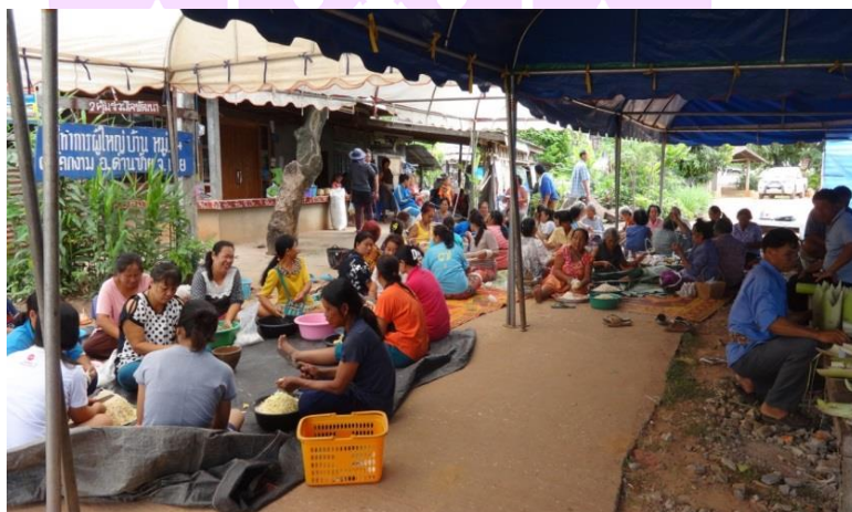
ภาพ 39 แสดงชาวบ้านช่วยกันจัดเตรียมสถานที่และเครื่องประกอบพิธีในวันหนึ่ง

1.9 การจัดเตรียมอาหารหวานคาวสำหรับเลี้ยงชาวบ้านที่มาช่วยงาน กลุ่มแม่บ้านประจำหมู่บ้านเป็นผู้ที่รับหน้าที่จัดเตรียมข้าวปลาอาหารไว้สำหรับเลี้ยงชาวบ้านที่มาช่วยเตรียมงาน ซึ่งอาหารส่วนใหญ่ก็จะเป็นอาหารประจำถิ่น เช่น ส้มตำ เมี่ยงหัวทูน แกงหน่อไม้ ข้าวต้มคั่ว ข้าวต้มหมก เป็นต้น และอาหารส่วนหนึ่งชาวบ้านที่ใครพอจะมีอะไรก็นำมารวมกัน เช่น ข้าวสาร มะพร้าว น้ำตาล ผักผลไม้ต่าง ๆ ฯลฯ