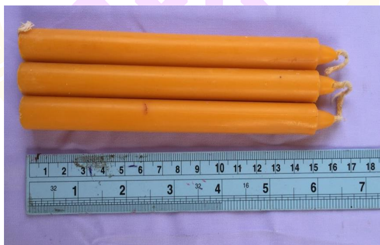
ภาพ 13 แสดงเทียนใต้ (เทียนสำหรับใช้จุดในพิธี)

4.1.6 เทียนใต้ (เทียนสำหรับใช้จุดในพิธี) จำนวน 3 เล่ม คือเทียนสำหรับจุด เวลาพระสงฆ์เจริญพระพุทธมนต์ โดยนำไปปักไว้ตรงจอกทราย จอกข้าวเปลือก และจอก ข้าวสาร อย่างละ 1 เล่ม