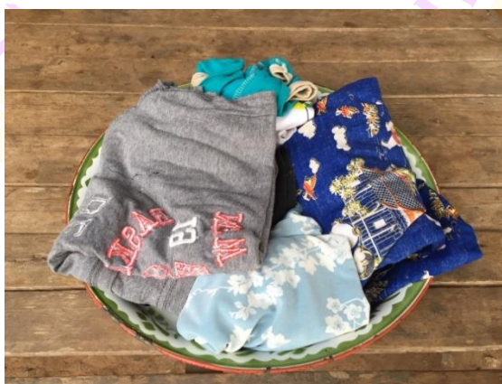
ภาพ 61 แสดงเสื้อผ้าของผู้รับการเฮ็ดเวียกเสียน

4.10 เสื้อผ้าของผู้รับการเฮ็ดเวียก คือเสื้อผ้าที่ใส่ในชีวิตประจำวันของแต่ละคนที่อาศัยอยู่ในเรือนนั้นคนละ 1 ตัว