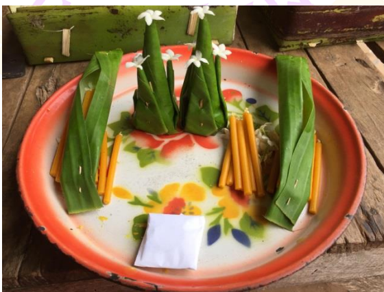
ภาพ 57 แสดงชั้นคายหรือชั้นครู

4.3 ชั้นคายหรือชั้นครู สำหรับให้อาจารย์ธรรมไว้ใช้ทำพิธีบูชาครูอาจารย์ก่อนจะทำพิธีเฮ็ดเวียกเฮียน โดยใช้ธาดหรือจวนก็ได้เป็นภาชนะรอง ในชั้นคายประกอบด้วย ต้นหมากเบ็ง 1 คู่ ชั้นห้า (เทียน 5 คู่ ดอกไม้ 5 คู่) ชั้นแปด (เทียน 8 คู่ ดอกไม้สีขาว 8 คู่) เงิน 117 บาทตามกำลังวันทั้งหมด และห่อนิมนต์ 1 คู่ ซ้ายขวาทำจากใบตองขนาดความกว้างประมาณ 6 เซนติเมตร ความยาวประมาณ 15 เซนติเมตร พับซ้ายขวาเข้าหากันแล้วกลัดด้วยไม้กลัดทั้งหัวและท้ายข้างในใส่ดอกไม้สีขาวและเทียนเล่มเล็กอย่างละ 1 คู่ (บุญเรือน วังศิริ, ผู้ให้สัมภาษณ์, 8 ธันวาคม 2560)