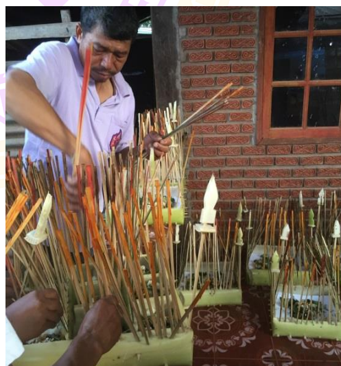
ภาพ 46 แสดงการปักช่อปักธงรอบกระทงแต่ละประเภท