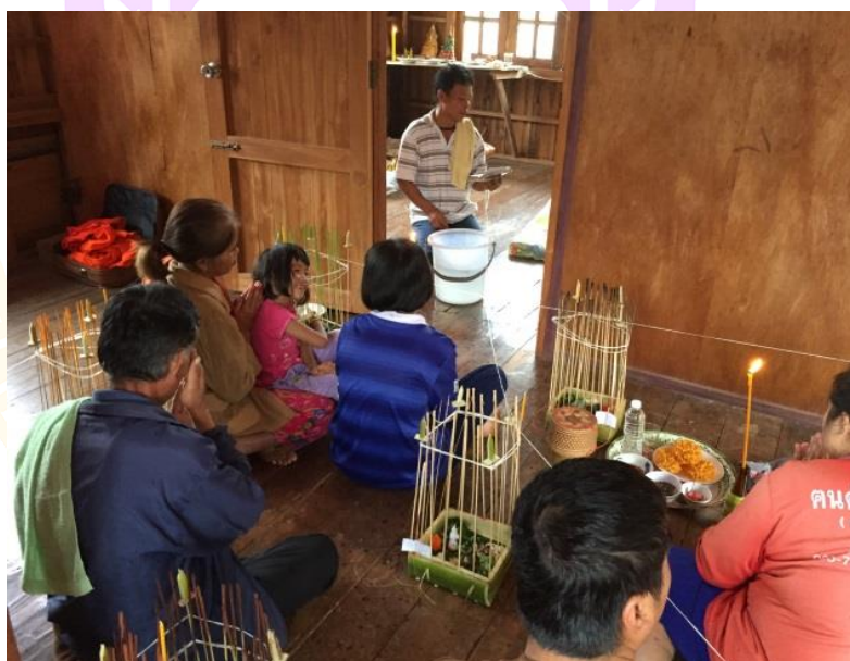
ภาพ 73 แสดงอาจารย์ธรรมสวดบทเห็ดเหียกเหียนให้แก่ผู้รับการเห็ดเหียก

พอสวดจบถึงตรงนี้อาจารย์ธรรมประพรมน้ำส้มป่อยสามครั้งให้กับผู้รับการ เห็ดเหียกทุกคน จากนั้นอาจารย์ธรรมลุกขึ้นจากที่นั่งพร้อมกับนำเทียนมาจุดด้วยสายสิญจน์ ที่เวียนรอบกระทงไปที่ละกระทงจนครบ หลังจากขั้นตอนการสวดบทเห็ดเหียกเหียนเสร็จแล้ว จะเป็นขั้นตอนการประพรมน้ำมนต์