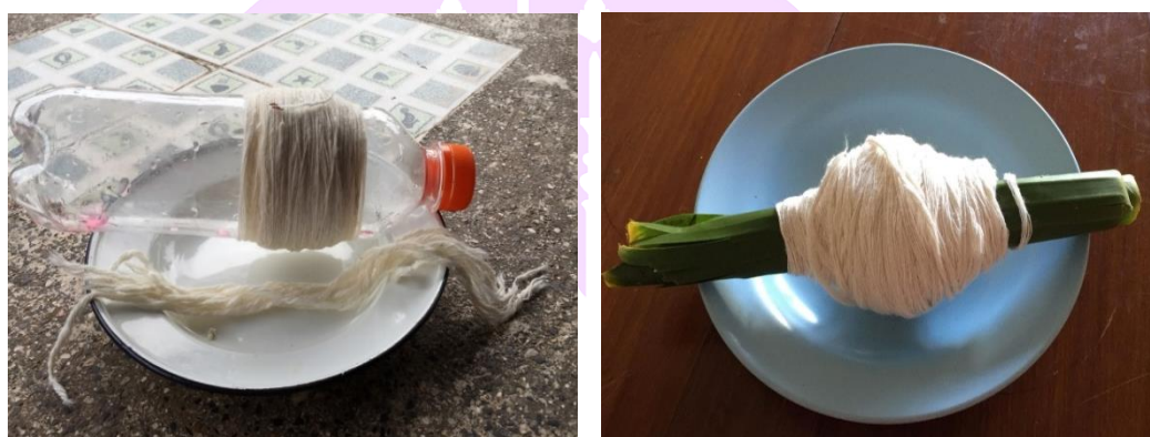
ภาพ 60 แสดงฝ้ายเฮ็ดเวียก ฝ้ายผูกแขน และฝ้ายอ้อมเสียน

4.9 ฝ้ายผูกแขน คือ เส้นฝ้ายสีขาวมีความยาวประมาณ 20 เซนติเมตร สำหรับให้อาจารย์ธรรมปลุกเสกแล้วนำไปผูกแขนให้กับผู้รับการเฮ็ดเวียกคือทุกคนที่อาศัยอยู่ในเรือนนั้น