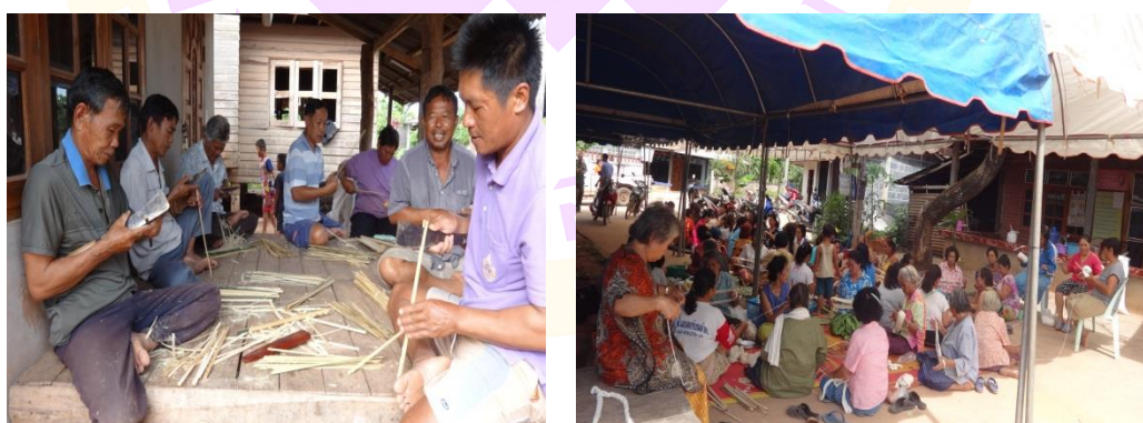
ภาพ 38 แสดงชาวบ้านผู้ชายและชาวบ้านผู้หญิงกำลังช่วยกันจัดเตรียมเครื่องบูชา และเครื่องเซ่นไหว้

1.7 การจัดเตรียมเครื่องบูชาและเครื่องเซ่นไหว้ มีการแบ่งหน้าที่กันจัดเตรียม ระหว่างผู้ชายและผู้หญิง ในส่วนของชาวบ้านผู้ชายจะมีหน้าที่ทำต้นเสดกะสัด เครื่องประกอบ ลีทิด ส้านจอกแก้ว (แทนบูชา) ช่อธง เป็นต้น ในส่วนของชาวบ้านผู้หญิงมีหน้าที่จัดเตรียม พาบัญคุณ (พานมงคล) ฝ้ายอ้อมบ้าน คำหมาก เมียง บุหรี่ กัลวย อ้อย ซึ่งต้องใช้เป็นจำนวนมาก และเครื่องประกอบพิธีกรรมอีกอย่างหนึ่งที่ชาวบ้านในแต่ละครัวเรือนจะต้องเตรียมมาเอง ก็คือธูปใส่กรวดทรายและธูปน้ำสำหรับนำกลับไปทำพิธีที่เรือนของตนเอง ซึ่งรายละเอียดของ เครื่องประกอบพิธีกรรมแต่ละประเภทผู้วิจัยได้อธิบายไว้แล้วในหัวข้อเครื่องประกอบใน พิธีกรรมเฮ็ดเวียกหมู่บ้านข้างต้น