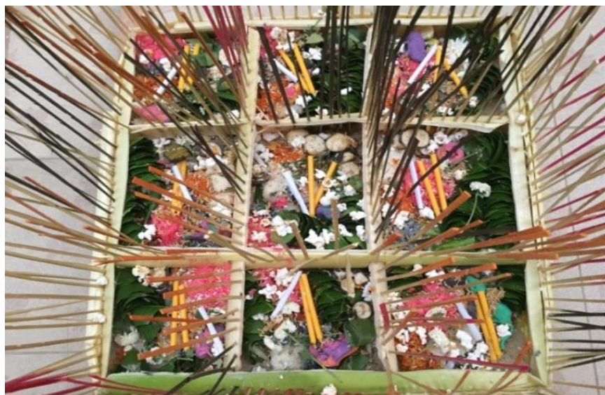
ภาพ 33 แสดงกระทงเก้าห้อง

4.10 กระทงเวียงใน เป็นกระทงที่ทำจากกาบกล้วยพับให้เป็นลักษณะถาดสี่เหลี่ยม กว้างยาวด้านละประมาณ 20 เซนติเมตร พื้นใช้ไม้ไผ่เสียบเป็นตะแกรงแล้วปูรองด้วยใบตองหรือกระดาษ มีจำนวน 4 กระทง คือ