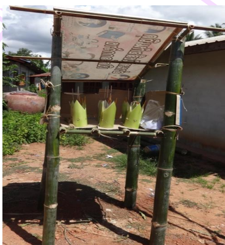
ภาพ 23 แสดงฮ้านจอกแก้ว (แทนบูชา)