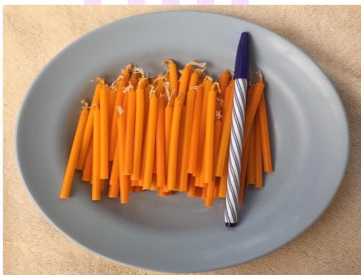
ภาพ 29 แสดงเทียนเล่มเล็ก

4.9.8 เทียนเล่มเล็ก นับใส่ลงในกระทงห้องละ 2 เล่ม หรือจะใส่ห้องละ 8 เล่มก็ได้