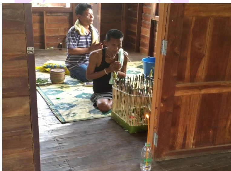
ภาพ 78 แสดงขณะที่อาจารย์ธรรมกำลังประกอบพิธีสวดเห็ดเวียงส่งราหู

พอสวดจบถึงตรงนี้ในแต่ละจบอาจารย์ธรรมประพรมน้ำส้มป่อยสามครั้งให้กับ ผู้รับการเห็ดเวียงส่งราหู จากนั้นอาจารย์ธรรมลุกขึ้นจากที่นั่งพร้อมกับนำเทียนมาจุดท้าย สายสิญจน์ที่เวียนรอบกระทง