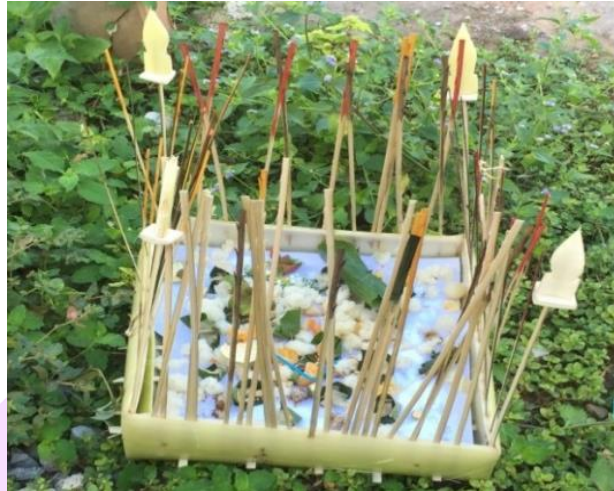
ภาพ 35 แสดงกระทงเวียงนอกทิศทักษิณ (ใต้)

4.12 คุตทรายแฮ เป็นอุปกรณ์ที่ทำจากฝากะต๋ิบข้าวเหนียว ปัจจุบันชาวบ้าน บางรายจะใช้ถังพลาสติกแทน ซึ่งภายในใส่ทราย แฮ่ (กรวด) ขวดใส่น้ำ และฝ้ายผูกแขนซึ่งมัดไว้ตรงปากขวดน้ำ ตามจำนวนของสมาชิกในครอบครัว นำกรวยที่ทำจากใบตองคว่ำปิดปากขวดน้ำไว้