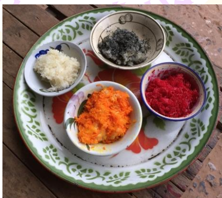
ภาพ 27 แสดงข้าวดำ ข้าวแดง ข้าวเหลือง ข้าวขาว

4.9.6 ข้าวดำ ข้าวแดง ข้าวเหลือง ข้าวขาว เป็นข้าวเหนียวที่นึ่งเสร็จแล้วนำมาคลุกกับสีที่ต้องการ เป็นสีที่หาได้จากท้องถิ่นหรือตามธรรมชาติ เช่น สีดำได้จากผงถ่าน งามดำหรือซีเมนต์ไฟ สีแดงได้ปูนที่ใช้กินหมากผสมกับขมิ้น สีเหลืองจากขมิ้น หรือไข่ต้มส่วนที่เป็นไข่แดง ชาวบ้านหนองหลวงเรียกว่า “มอนไข่” ส่วนข้าวขาวได้จากข้าวเหนียวนึ่งธรรมดา ทั้งหมดปั้นเป็นก้อนเล็ก ๆ ใส่ลงไป ในกระทงห้องละ 8 ก้อน