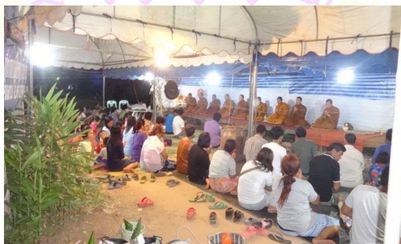
ภาพ 45 แสดงพระสงฆ์เจริญพระพุทธมนต์ในคืนวันที่สอง

2. ขั้นตอนการดำเนินการ ในขั้นตอนการดำเนินการในวันที่สองมีลำดับขั้นตอนเหมือนกับคืนวันแรกทุกประการ คือ มีขั้นตอนการบูชาพระรัตนตรัย อาราธนาศีล และอาราธนาพระปริตร ขั้นตอนการเจริญพระพุทธมนต์ ขั้นตอนการทำน้ามนต์ ขั้นตอนการถวายเครื่องไทยธรรมแด่พระสงฆ์ และขั้นตอนหลังจากการเจริญพระพุทธมนต์เสร็จ