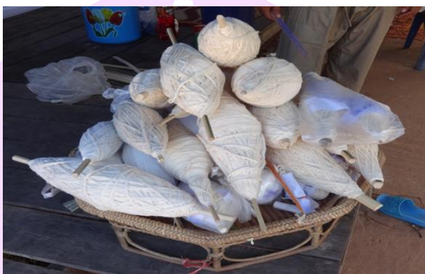
ภาพ 18 แสดงฝ่ายอ้อมบ้านสำหรับนำไปล้อมรอบทั่วหมู่บ้านหลังจากเสร็จพิธีกรรม

4.4 ฝ่ายอ้อมบ้าน (สายสัญญาณสำหรับรอบหมู่บ้าน) คือด้ายสายสัญญาณที่ทำจากฝ่ายหรือเรียกว่าด้ายดิบโดยผ่านกระบวนการต่าง ๆ จนได้เป็นด้ายเส้นเล็ก ๆ จากนั้นชาวบ้านจะช่วยกันถัก 9 เส้นด้ายให้เป็น 1 เส้นสายสัญญาณ หรือที่ชาวบ้านหนองหลวงเรียกว่า “สาวด้ายหรือจับด้าย” เพื่อใช้รอบทั้งหมู่บ้านหลังจากที่ประกอบพิธีกรรมเสร็จ (วาด สายโสภณ, ผู้ให้สัมภาษณ์, 4 มิถุนายน 2560)