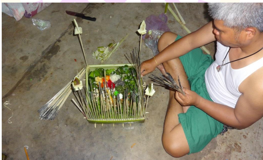
ภาพ 77 แสดงการจัดเตรียมกระทงเฮ็ดเวียกส่งราหุ

1.3 การจัดเตรียมเครื่องประกอบบูชา เครื่องเช่น ไห้ว และสิ่งของต่าง ๆ เมื่อเตรียมกระทงเฮ็ดเวียกส่งราหุแล้ว ผู้รับการเฮ็ดเวียกพร้อมกับญาติพี่น้องหรือผู้ที่มีความรู้ในด้านนี้ช่วยกันจัดเตรียมซึ่งได้แก่ ชนคาย ถึงสำหรับทำนํ้ามนต์ ฝ้ายเฮ็ดเวียก ฝ้ายผูกแขน มีดดาบ เทียนเวียนหัว และจัดเตรียมสิ่งของที่จะใส่ลงในกระทงเฮ็ดเวียกส่งราหุ ได้แก่ ช่อธงสีดํา คำเมียง คำหมากพลู แกงส้ม แกงหวาน กลัวยั่นเป็นชั้นเล็ก ๆ อ้อยตัดเป็นชั้นเล็ก ๆ จอกส้ม จอกหวาน ข้าวดํา ข้าวแดง ข้าวเหลือง ข้าวขาว รูปปั้นหนู ดอกไม้ เทียนเล่มเล็ก รูปข้าวตอกแตก ข้าวเปลือก และข้าวสาร