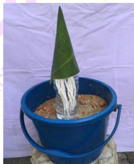
ภาพ 36 แสดงคุตทรายแฮ่