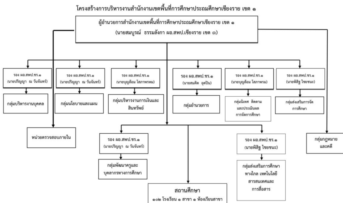
ภาพ 2 แสดงโครงสร้างการบริหารของสำนักงานเขตพื้นที่การศึกษา ประถมศึกษาเชียงราย เขต 1