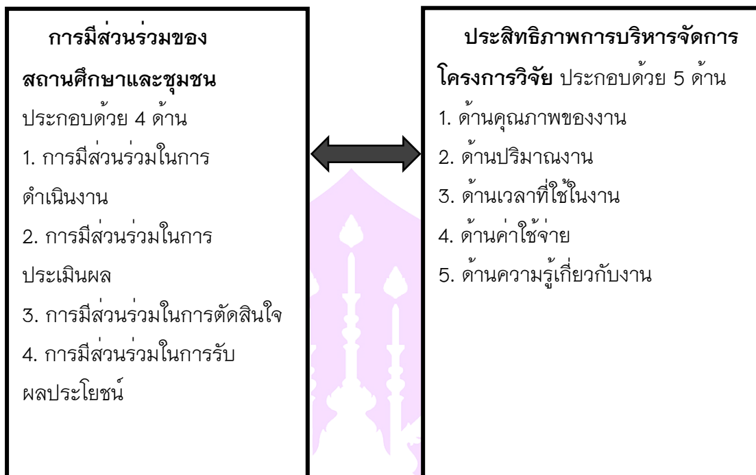
ภาพ 1 แสดงกรอบแนวคิดการวิจัย