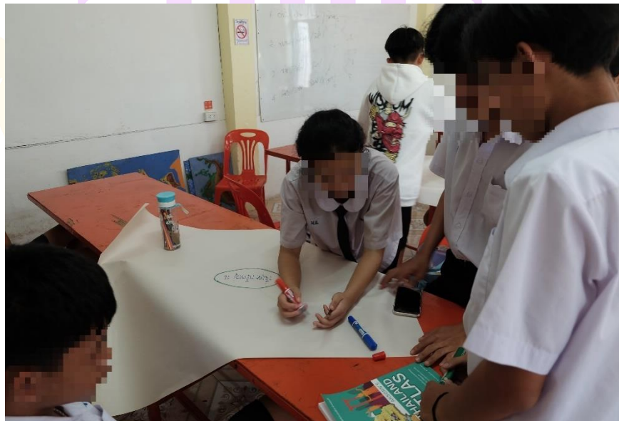
ภาพ 3 กิจกรรมการเรียนรู้ขั้นปฏิบัติการ