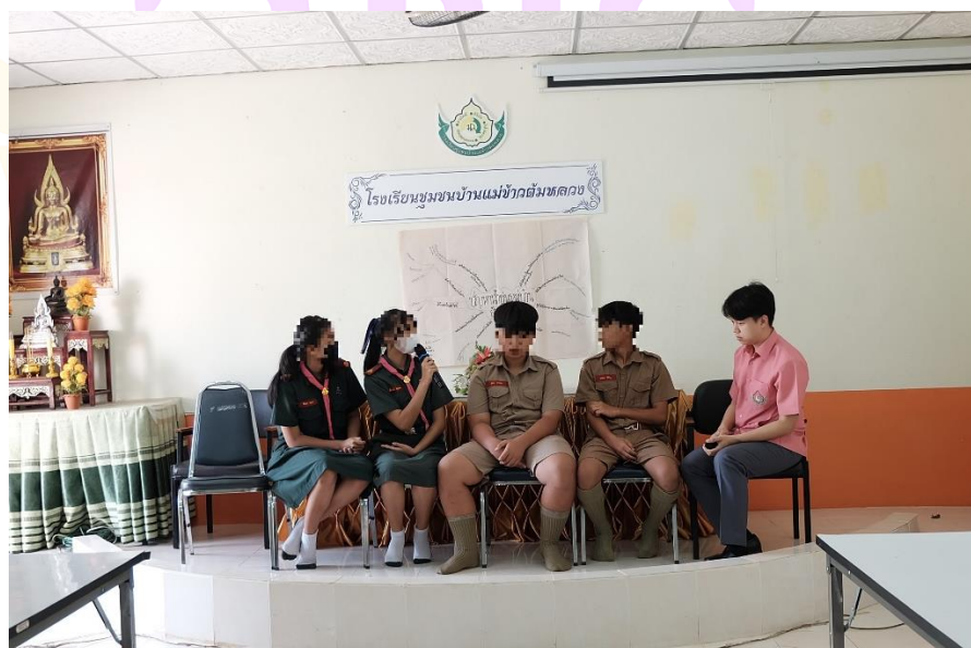
ภาพ 5 กิจกรรมการเรียนรู้ชั้นสรุป และพัฒนา