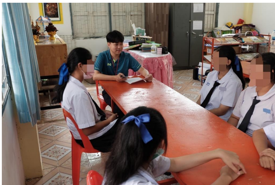
ภาพ 6 การสัมภาษณ์กลุ่มนักเรียน 1