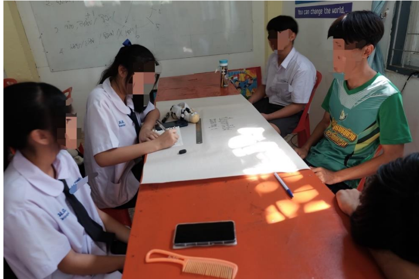
ภาพ 2 กิจกรรมการเรียนรู้ขั้นเตรียมการ