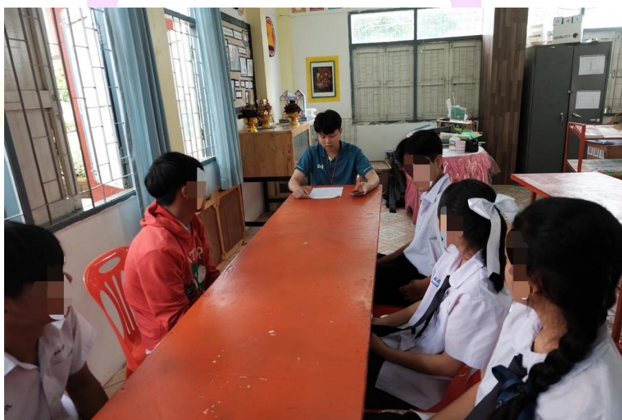
ภาพ 7 การสัมภาษณ์กลุ่มนักเรียน 2